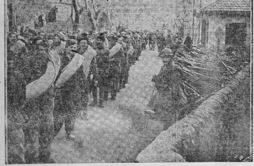
Los milicianos rojos españoles al llegar a la frontera francesa entregan sus armas a los agentes y guardias móviles de la vecina República. Después de haberlas pagado espléndidamente con el oro robado a España, los marxistas españoles devuelven esas armas a quienes se las entregaron para luchar contra la integridad e independencia de nuestra Patria.

Ofertas a Panaderos 35, entresuelo. Teléfono 2365.