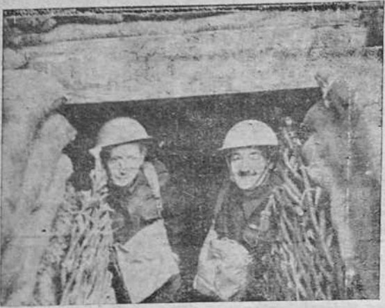
Soldados ex-combatientes de la guerra 1914 a 1918 prestando servicio en uno de los refugios de defensa anti-aérea de Londres.

La Coruña.-Año XXIII.-Num. 6.220 MARTES, 10 OCTUBRE DE 1939 Redacción 1177. Administración 1542 Avenida de Rubine, 10. Tl.º Dirección