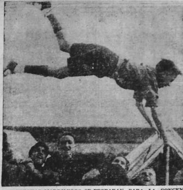
LOS FLECHAS MADRILEÑOS SE PREPARAN PARA LA CONCENTRACION DEL 20 DE OCTUBRE

Para ellos especialmente ha sido creado el "Vegetal Richelet" el cual combate las dolencias y enfermedades propias de la infancia como Enfermedades de la Piel, vegetaciones, usagre, erupciones, colores pálidos, etc.