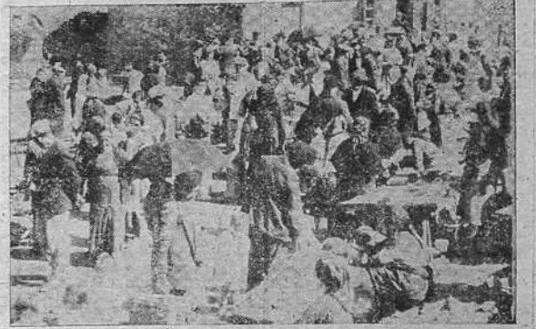
Un aspecto del mercado que se celebró el domingo alrededor del Santuario de Pastoria (Foto EL IDEAL GALLEGO).

LONDRES 9.—Las autoridades de los puertos británicos están estableciendo equipos de descargadores, que podrán ser transportados de unas localidades a otras para hacer los cambios de ruta marítima que se vean obligados a hacer algunos buques. Estos traslados serán hechos en autobuses de un puerto a otro para la rápida carga y descarga de los convoyes de navíos mercantes, que por diversas circunstancias se ven obligados a atracar en puerto distinto al fijado para su destino. (STEFANI).