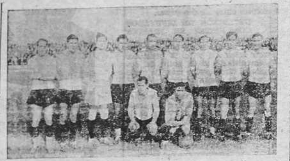
El equipo del Deportivo, que el domingo venció por 4-0 al Coruña