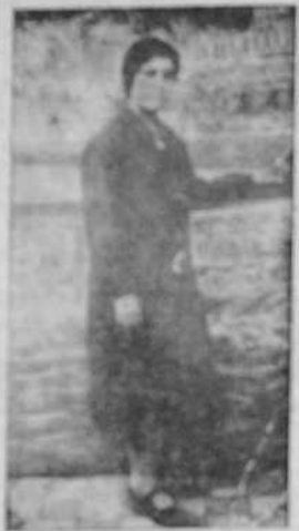
El autor de los billetes falsificados, un joven pintor que trabajaba en el Hogar Provincial de Ciudad Real.

Había leído en una novela que a un falsificador de billetes le daban un empleo