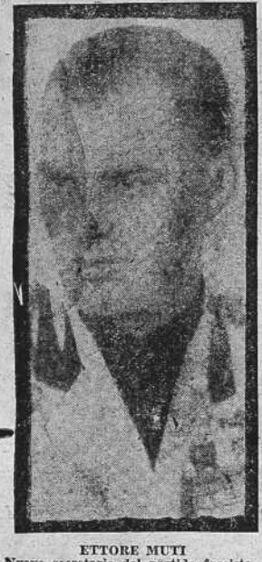
ETTORE MUTI Nuevo secretario del partido fascista

La Coruña.—Año XXIII.—Núm. 6,247 VIERNES, 10 NOVIEMBRE DE 1939 Avenida de Rubián, 10. Tl. Dirección y Redacción 1177. Administración 1533