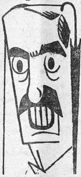
que están unidos a nosotros en la lucha.

mando al buque británico y más cerca. Le lanzó otro que acabaron por hundir. La tripulación del sumergible ayudó a los marineros del mercante a ponerse en salvo y acompañó a las lanchas de salvamento hasta el Sur de Irlanda. El capitán del buque británico expresó su agradecimiento a los marinos alemanes por su comportamiento caballeresco.