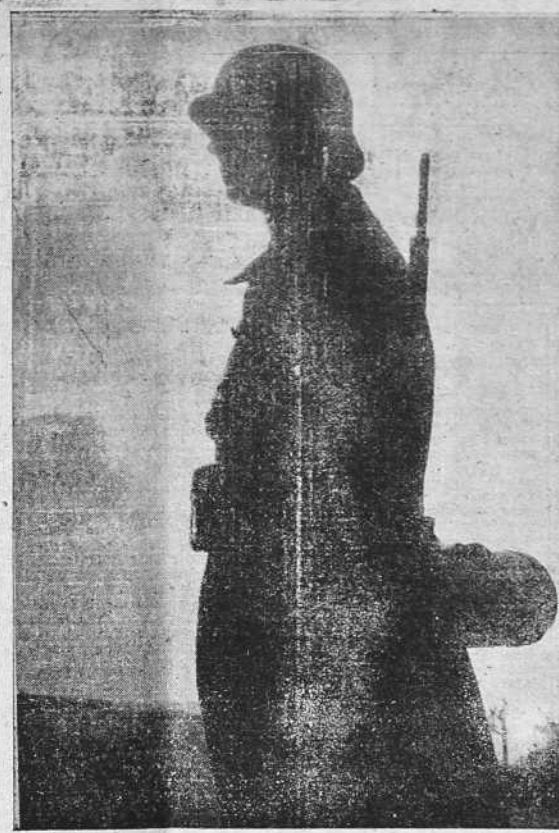
Un centinela tótón en el frente franco-alemán.