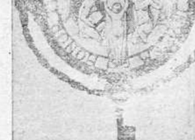
Figura en el anverso de la Medalla el escudo de armas que le correspondió, formado conforme al documental...