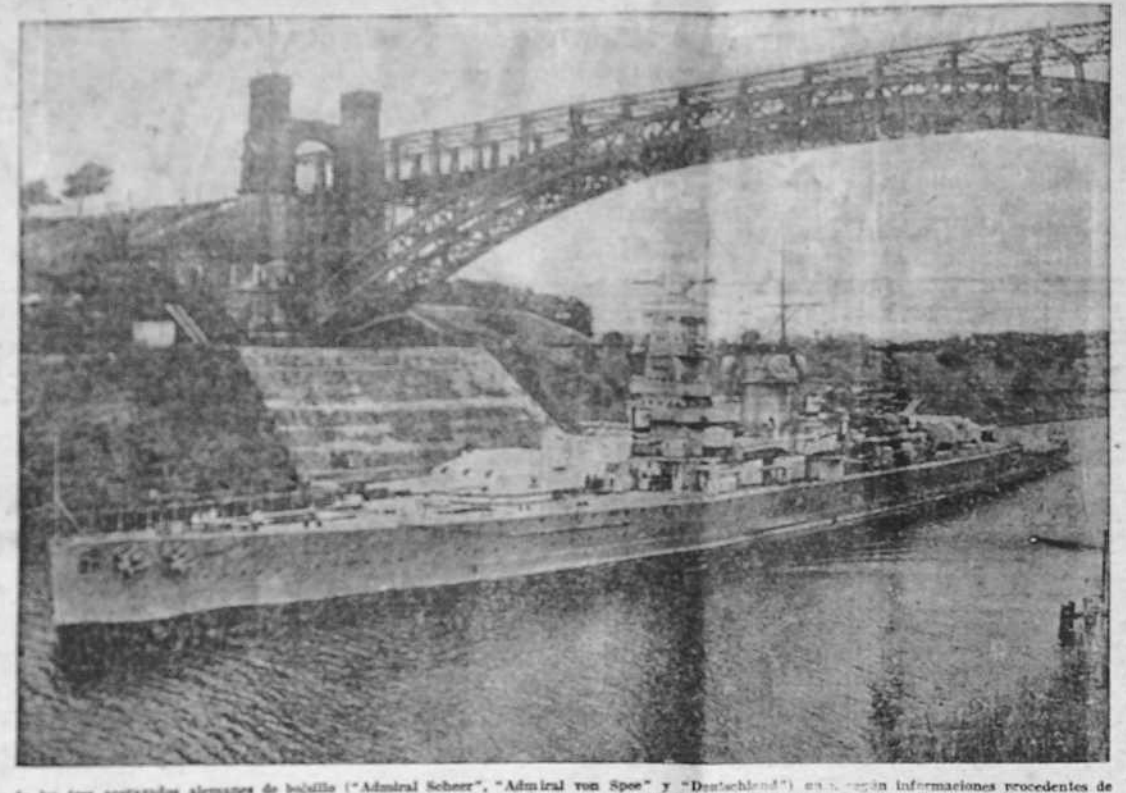
Uno de los tres acorazados alemanes de bolsillo ("Admiral Scheer", "Admiral von Spee" y "Deutschland") en un combate librado en el Atlántico Sur. Cada uno de los citados navios alemanes desplaza 12.900 toneladas.