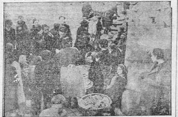
Un aspecto del mercado de rosquillas celebrado a la puerta de la Iglesia parroquial de Santa Lucía, con motivo de la festividad de la Patrona de los ciegos

MADRID 13.—Un donativo de 25 mil pesetas para atenciones de Beneficencia, que prepara el Ayuntamiento para las próximas Pascuas de Navidad, ha entregado el Banco Hispanoamericano. La Casa Pánuco entregó con el mismo fin dos mil pesetas.—(C.F.F.A.)