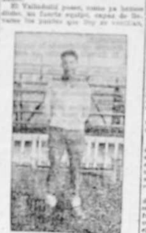
El capitán del Deportivo...