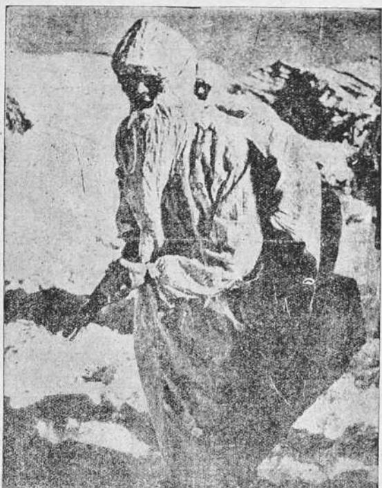
Un aspecto de la lucha en las regiones heladas de Finlandia. He ahí a los esquiadores camuflados con vestiduras blancas, que desde cierta distancia dan la impresión de ser rocas cubiertas por la nieve. Estas patrullas se filtran en las líneas soviéticas y causan a los invasores bajas innumerables de refresco en grandes cantidades. Estas concentraciones fueron bombardeadas hoy por la aviación finlandesa.—(EFE).

HELSINKI, 30.—Después de la batalla de refresco de días pasados y ante la que parece prepararse por parte soviética, tanto en Laponia como en Carelia, el día de ayer se ha caracterizado por una relativa calma. Durante los tres últimos días, los lujos desencadenaron ataques tras ataque contra la línea Mannerheim, pero todas las ofensivas fueron rechazadas y las líneas fortificadas finlandesas continúan intactas. Se observa con sorpresa que la preparación artilleja que ha precedido a estos ataques ha estado mejor dirigida que anteriormente, y se cree que la vez próxima se utilizará en la presencia de técnicos militares extranjeros en las líneas soviéticas. Los rusos están concentrando tropas