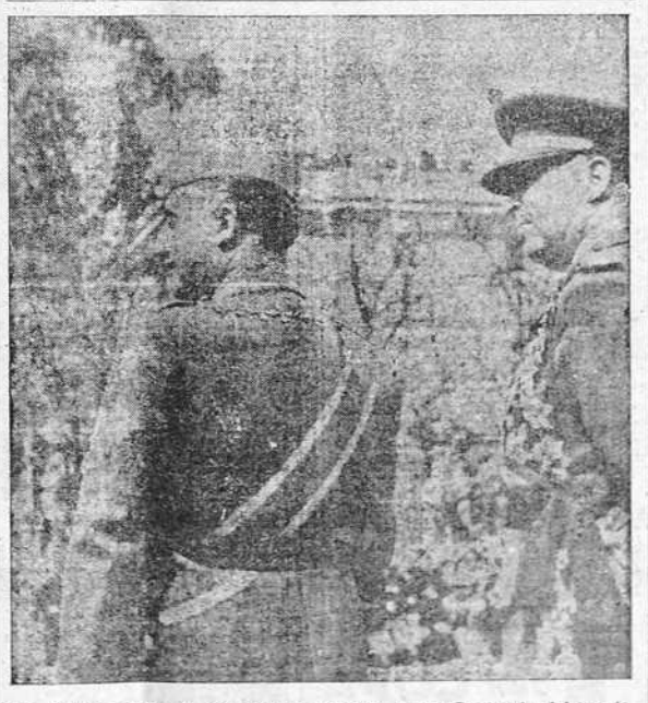
S. E. el Jefe del Estado, Generalísimo Franco, acompañado del ministro de la Guerra, general Varela, preside el gran desfile militar celebrado con motivo del primer aniversario de la Victoria.

A medida que transcurren los días aumenta la demanda de billetes. Las categorías A y B están ya casi agotadas. Con este motivo llamamos una vez más la atención, pues los viajeros tendrán que resignarse a ser vitineros. Recordamos a nuestros lectores que en todas las ciudades de Galicia, Galicia hay comisiones encargadas de recoger las inscripciones. En La Coruña pueden hacerse indistintamente todos los días de 1 a 2 en Acción Católica y de 6 a 7 en Santa Lucía. Esto mismo vale para Lugo y Santiago, desde donde pueden dirigirse a los referidos centros, ya personalmente, ya por medio de correspondencia. Otra vez recordamos también que la peregrinación saldrá de Mondoñedo el día 7 de junio para regresar el día 13, y que se harán escalas en Burgos, Madrid y Valladolid. Los precios son: categoría A, 296 pesetas; B, 267, C, 223, y D, 195. Para dudas y consultas, preguntar a A. Católica, Santa Lucía o al M. I. señor Abad de la Colegiata.