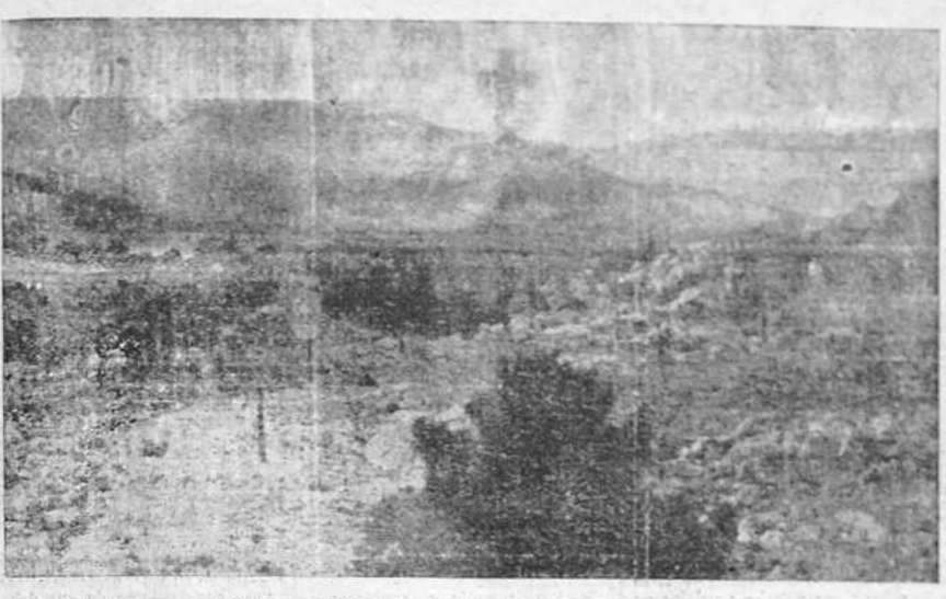
En uno de los lugares más abruptos de la sierra del Guadarrama va a ser erigido el grandioso monumento que perpetuará la memoria de todos los Caídos por Dios y por España. El sitio, que ha sido elegido personalmente por el Caudillo, recibirá el nombre de Valle de los Caídos. Una cruz monumental rematará el edificio que será visible a la distancia de unos sesenta kilómetros. Entre el Monasterio famoso que un día mandó construir el Rey Prudente cuya soberanía se extendió sobre el más grande Imperio de España, y el pueblito del Guadarrama, mudo testigo del heroísmo y abnegación de los soldados de Franco, se levantará el monumento que, en la soledad de aquellos parajes rocosos, será como la invocación perenne de España a sus muertos. La construcción ha sido ya simbólicamente inaugurada. El grabado reproduce el lugar señalado con una cruz donde va a ser cimentado el monasterio-basilica, lugar de reposo de los que ofrendaron su vida en la gloriosa Cruzada.