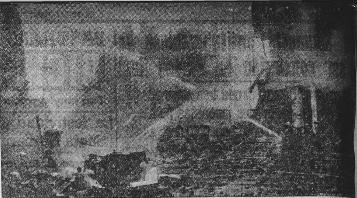
Aspecto desolador que ofrecía una de las principales calles del centro de Londres inmediatamente después del paso de una escuadra aérea alemana. Entre los escombros, los bomberos procuran localizar y extinguir los incendios.

BERLIN 2.—Según informes publicados por el alto mando de las fuerzas armadas alemanas, los aviones germanos de combate han continuado durante la noche del domingo al lunes, con una intensidad cada vez mayor, sus ataques sobre Southampton, donde han seguido bombardeando los focos de incendio. El resplandor de las explosiones ha podido ser observado con facilidad más allá de la Mancha, desde el Norte de Francia. La escasa actividad de la artillería antiaérea inglesa ha favorecido la precisión del tiro de los aviones alemanes.—(EFE).