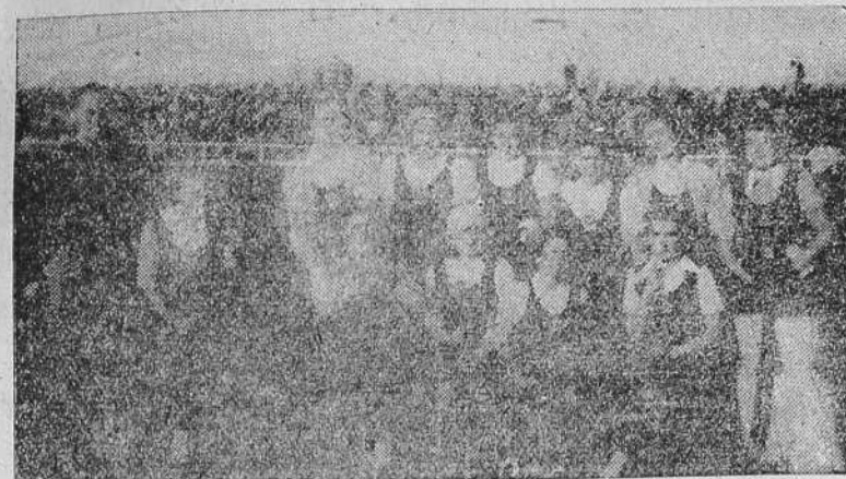
Equipo de hockey de la Sección Fenénina de Falange de Orense que se enfrentó con el de La Coruña el pasado domingo en Riazor

Malamente, el Deportivo fue sosteniendo la ventaja adquirida, hasta rematar los cuarenta y cinco primeros minutos de juego. Malamente, decimos, porque no supo aprovechar las frecuentes ocasiones que tuvo de superar el tanteo, marcando ese segundo gol que hubiera provocado un desfallecimiento en las filas ferrolanas. Y no las supo aprovechar—segundo desacierto—porque algunos de nuestros delanteros se "arrugaron" ante la dureza de los medios y defensas de-