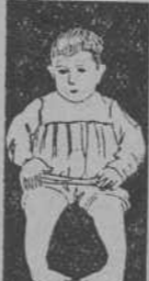
PIERNAS Y BRAZOS ARTIFICIALES