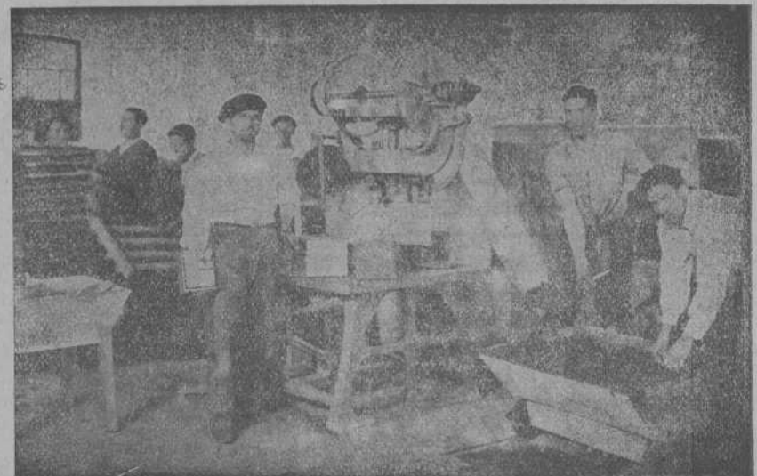
Vista de la sección de mosaico

Las especialidades de esta Fábrica, se basan en la fabricación de: Teja plana y curva, mosaicos, tuberías, etc., por disfrutar de excelentes y seleccionadas arenas, mezcla mecánica y riego por cámara pulverizadora.