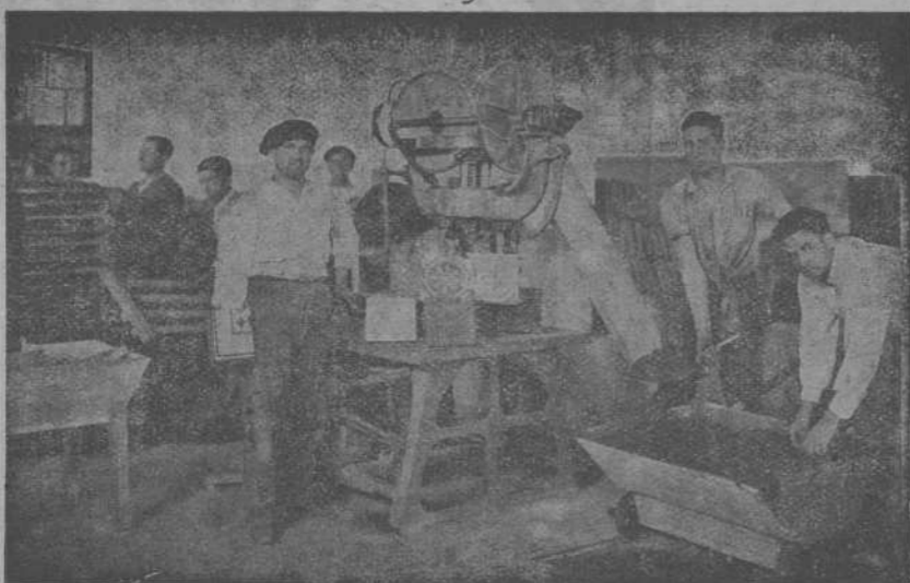
Vista de la sección de mosaico

Las especialidades de esta Fábrica, se basan en la fabricación de: Teja plana y curva, mosaicos, tuberías etc., por disfrutar de excelentes y seleccionadas arenas, mezcla mecánica y riego por cámara pulverizadora