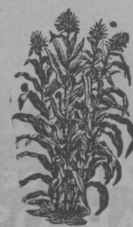
MAIZ.-Producción de 4 a 6 Espigas