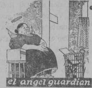
el angel guardian

Se calcula que aproximadamente pasan de diez millones de pesetas lo que en el presupuesto de Instrucción Pública ha habido de remanente solamente en lo que afecta a la Primera Enseñanza.