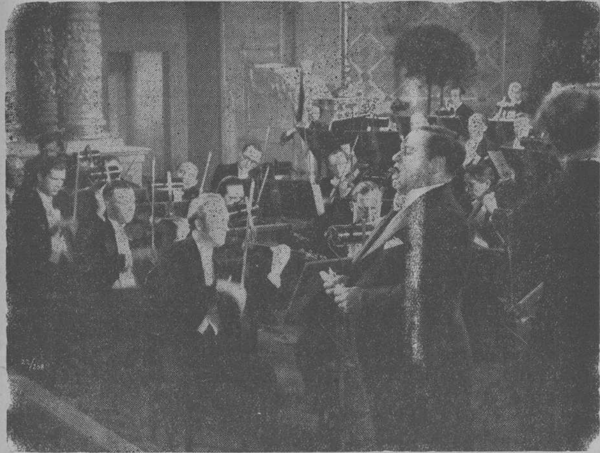
Uno de los momentos de la bellísima producción alemana NO ME OLVIDES, que presenta esta temporada CIFESA