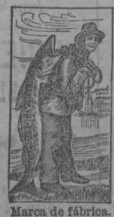
Marca de fábrica.