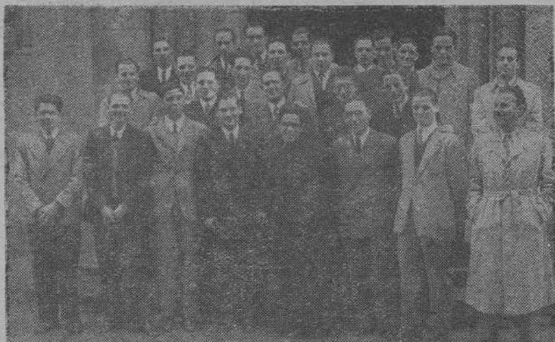
Afiliados al Centro Especializado Obrero de San José de A. C. de La Coruña, saliendo de la iglesia de San Andrés, donde tuvieron lugar diversos actos religiosos, solemnizando la fiesta de su Patrono