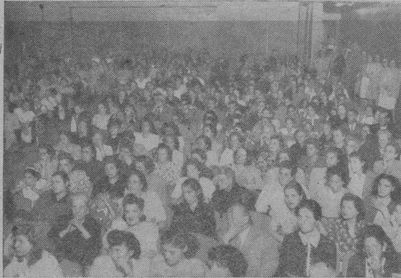
Un aspecto del patio de butacas del Cine Avenida durante la velada misional celebrada últimamente en La Coruña