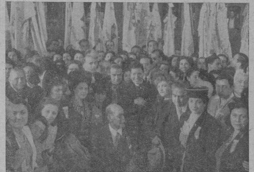
El Año Santo se acerca. América no quedará al margen del gran movimiento peregrinante. He aquí un grupo de mejicanos que recorre los santuarios marianos de nuestra Patria, atestigüando que en 1948 Méjico y la América Española sabrán empuñar el bordon camino de Compostela

hizo referéncia a la labor descubridora y colonizadora de España, Madre amantísima de veinte naciones, a las que enseñó a hablar en español y a sentir en cristiano. Con elocuente palabra explicó cómo, bajo el madrinazgo de la incomparable Reina Isabel, realizó España la empresa más trascendental que recuerdan los siglos. ¿Por qué? Porque la fe era su consigna, y ella le deparaba los más elevados fines. Terminó implorando a la Virgen del Cobre que acoja en su seno al pueblo cubano, preservándolo de los horrores del comunismo.