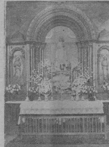
El altar de la Virgen del Cobre inaugurado en la iglesia de Santa Lucía (La Coruña)