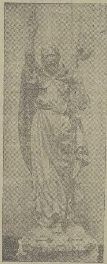
Imagen del Apóstol Santiago, que el Ayuntamiento compostelano regala a la República de El Ecuador

de Burgos. En los cargos de director espiritual de la Adoración Nocturna, Consiliario Diocesano de la Juventud Masculina de la Acción Católica y Consiliario de la delegación provincial de Prensa y Propaganda desarrolló una intensa actividad apostólica.