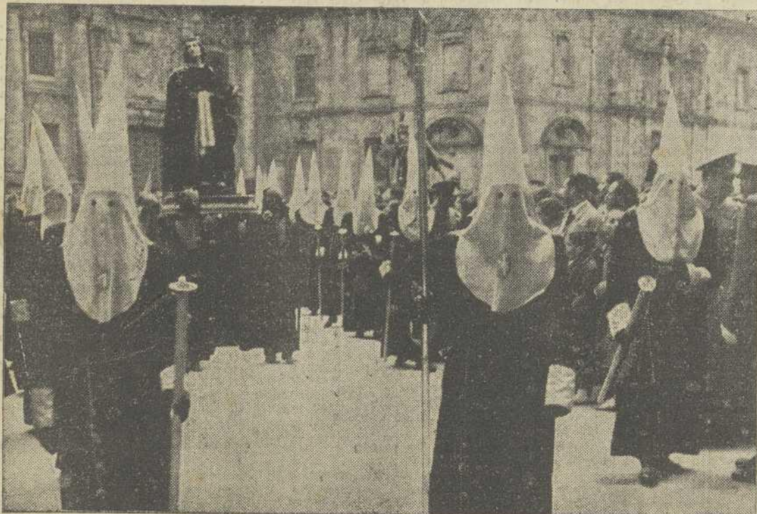
Un detalle de la procesión del Encuentro, en el que se ve a un grupo de encapuchados acompañando la imagen de S. Juan Evangelista

La A. C. archidiocesana, esencialmente jerárquica, besa reverente en esta solemnidad la Sagrada Púrpura de su Emmo. Prelado y quiere ser la primera en hacer realidad aquella identificación de preocupaciones y de anhelos.