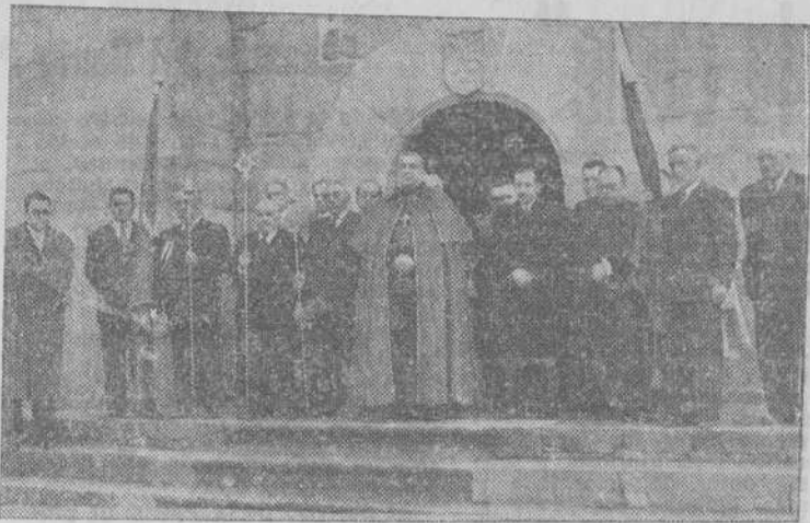
El Emmo. Sr. Cardenal Arzobispo, con las autoridades y directivos del Gremio de Mareantes de Pontevedra, posa ante la Casa Rectoral de Santa María, momentos antes de hacer su visita al barrio de la Moureira.

xilio Social. Con motivo del extraordinario servido a los niños que atiende esta Institución, visitó sus locales, bendijo la mesa y charló con muchos de los acogidos.