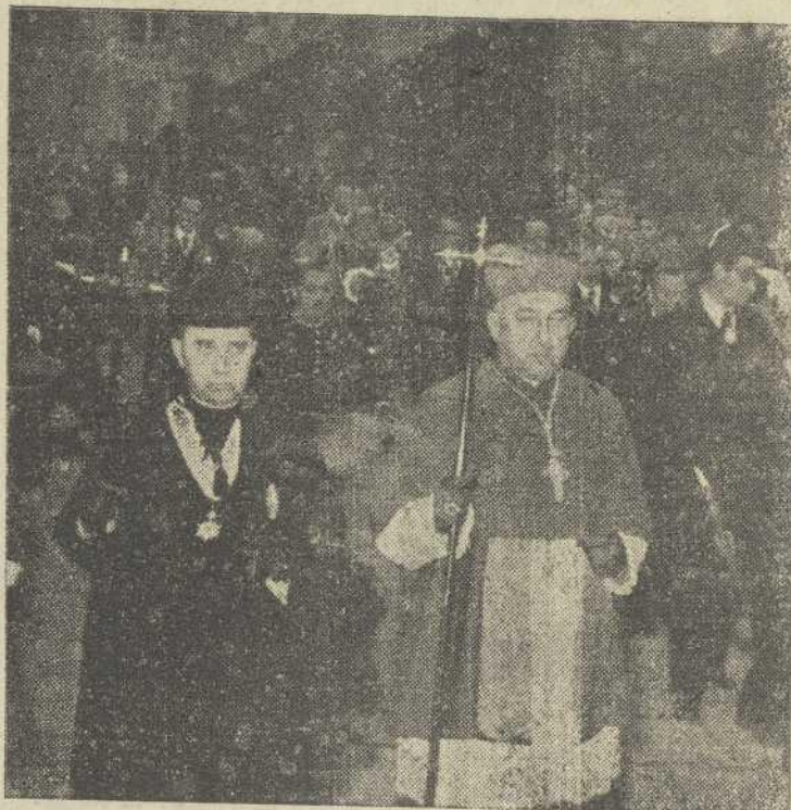
El Emmo. Sr. Cardenal Arzobispo, acompañado del M. I. señor Pro-Vicario General de la Archidiócesis, preside la procesión del Santo Entierro

Otra ceremonia de excepción es la de Consagración de los Santos Oleos, que tiene lugar en la mañana del Jueves Santo. En ella