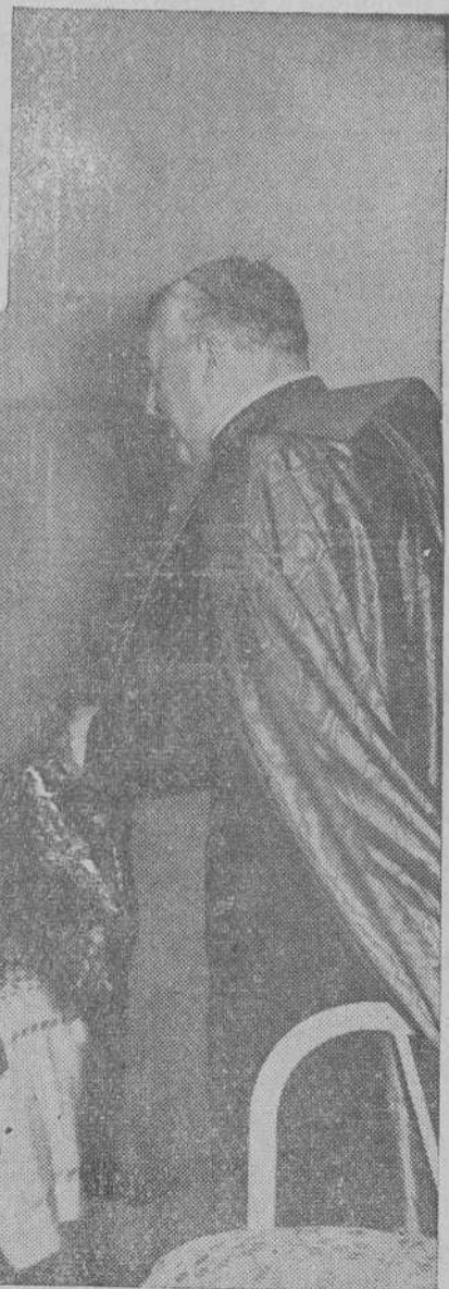
Su Eminencia departió cariñosamente con los seminaristas. Hele aquí conversando con los más pequeños.

Los seminaristas despidieron con muestras de afecto singular al Emmentísimo Prelado.