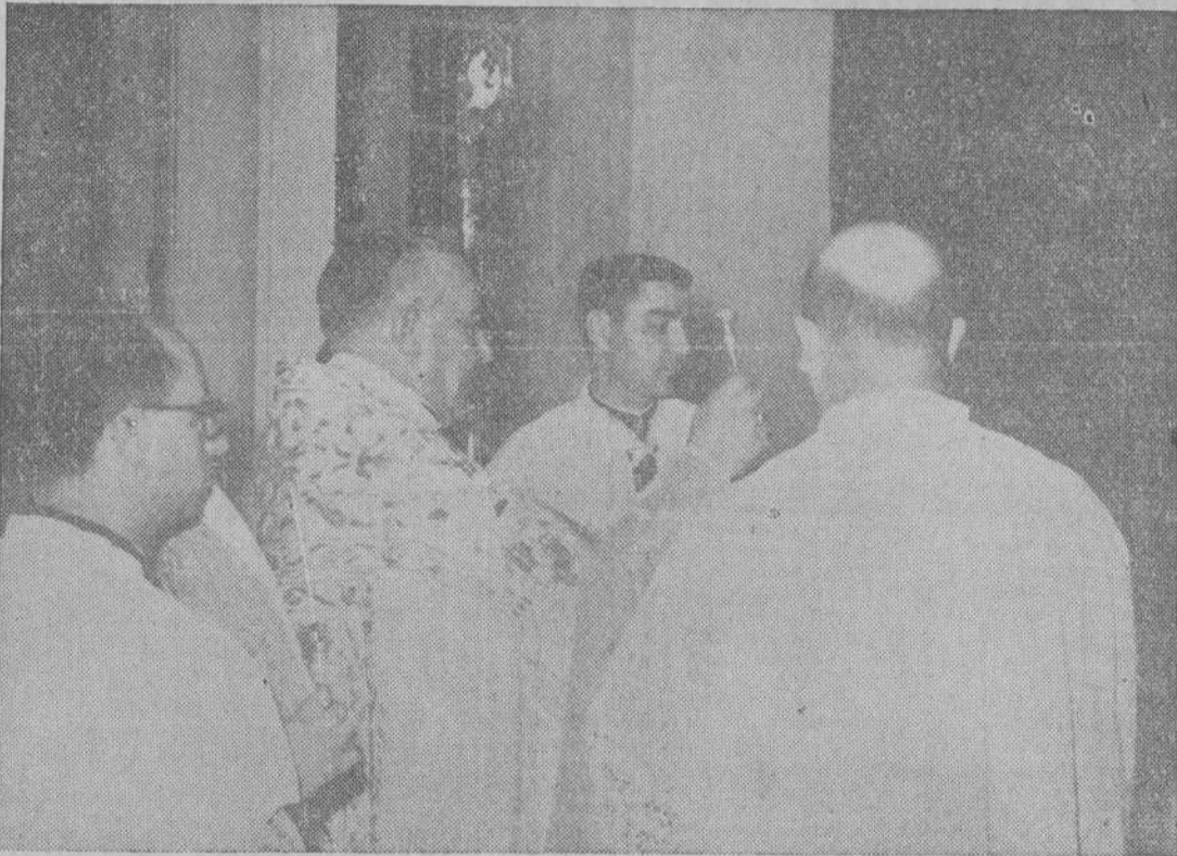
En la Capilla, provisionalmente instalada en lo que será Salón de Actos, el Sr. Cardenal Arzobispo bendice los ornamentos y vasos sagrados.

En ceremonia privada, Su Emcia. Rvdma. bendijo e inauguró la primera fase de las edificaciones.—Doscientos veinticinco alumnos de los dos primeros cursos de Humanidades, alojados en los nuevos pabellones