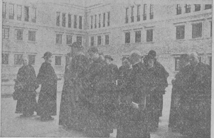
En la foto superior.—En su visita al Seminario Menor los Sres Arciprestes escuchan un amplio informe sobre la marcha de las obras. Abajo.—Con el Cardenal Arzobispo recorren la parte edificada y comprueban el estado actual de las obras

Precedida de un día de Retiro, tuve lugar en Santiago en los días 21, 22 y 23 del pasado septiembre, una Asamblea de Arciprestes de la Diócesis, que en número de 37, y presididos por el