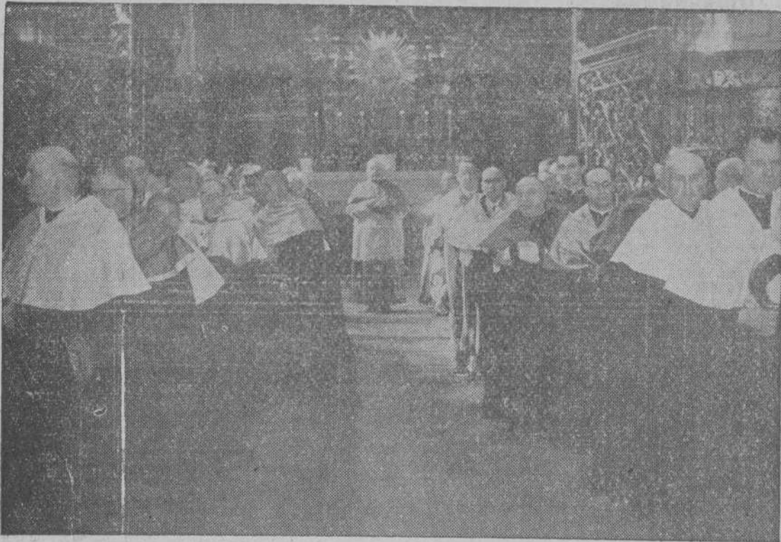
La comitiva, presidida por Su Eminencia, una vez terminado el acto, abandona la iglesia de S. Martín Pinario

El domingo, 2 de octubre, a las once media de la mañana se celebró en la iglesia de San Martín Pinario la solemne ceremonia de apertura del Curso académico 1955-56 en el Seminario Conciliar a la que asistieron todo el claustro de profesores, los alumnos, las autoridades de Compostela y numerosas personas más.