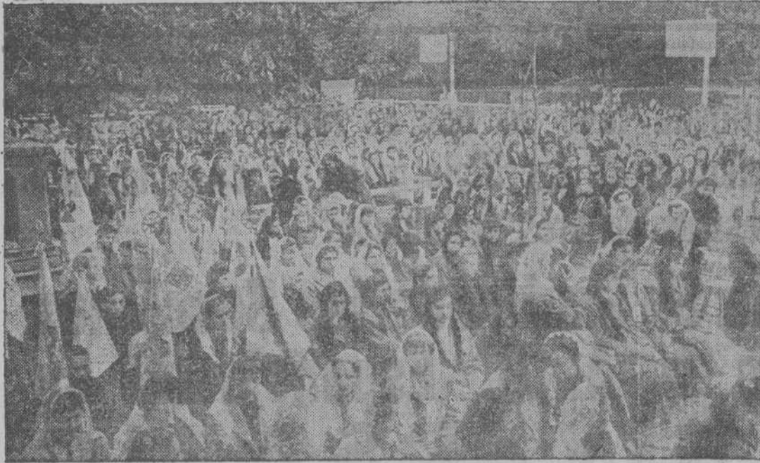
Una de las muchas concentraciones de menores que en toda España se organizaron para oír la voz del Papa

Bendición para cada una de vosotras, con vuestras familias, vuestros ideales y deseos, vuestra vida futura y todo lo que en estos momentos llevéis en la mente y en el corazón; bendición para vuestras asociaciones y para toda la gran familia de la Acción Católica Española; bendición para todas las niñas y jóvenes de vuestra Patria; bendición para toda esa España, tan querida, a la que el Vicario de Cristo desea siempre toda suerte de bienes y prosperidades.