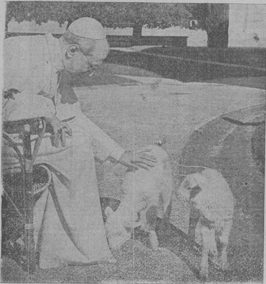
Una hermosa estampa. Su Santidad ama todo cuanto sea inocente y puro. Como el Divino Pastor, aparece aquí acariciando a unos corderitos que un pastor de Castellón regaló este verano, cuando se encontraba en Castellgandolfo.

apostolado que en vuestro ambiente podéis ejercer, ya desde ahora, en la escuela, entre vuestras amiguitas y acaso en vuestra propia familia. Y nadie sonría si os hablamos de apostolado a vosotras —niñas y jovencitas—, porque no sería la primera vez que el grande, el sabio o el poderoso han vuelto al buen sendero guiados por una manecita débil o arrastrados por una súplica inocente o una lagrimita ingenua.