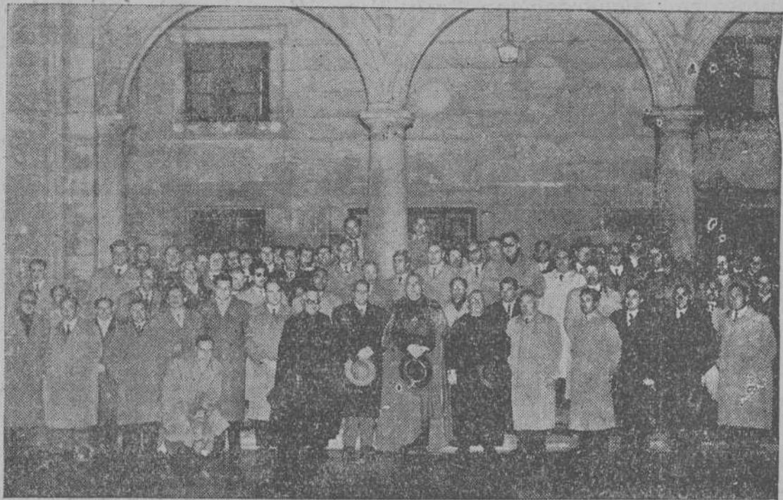
Asistentes a la X Asamblea Diocesana de Hombres de A. C. rodean al Excmo. Prelado, después del Acto de Clausura

El día 10 de este mes dió comienzo la X Asamblea General Diocesana de la Rama de los Hombres de Acción Católica.