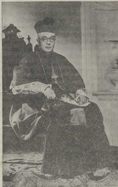
El Excmo. y Revmo. Sr. OBISPO AUXILIAR Delegado Diocesano de A. C.

Su Emcia. Revma. el Sr. Cardenal Arzobispo ha querido dar una prueba más de su afecto e interés por la Acción Católica al nombrar Delegado Diocesano al Excelentísimo y Revmo. Sr. Obispo Auxiliar.