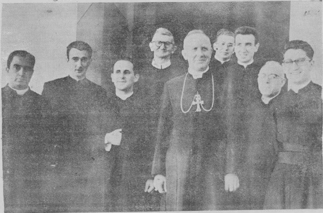
Un grupo de Sacerdotes compostelanos, procedentes de nuestro Seminario y de nuestras parroquias, que trabaja en Sucre (Bolivia), rodeando al Prelado de aquella diócesis americana.

ofrece a corto plazo. En un futuro inmediato es preciso enviar a las tierras bolivianas numerosos sacerdotes que puedan atender a las distintas facetas ministeriales. Mons. Maurer, Arzobispo de Sucre, en su visita a nuestra diócesis, ponía de relieve, en tonos ciertamente impresionantes, la urgencia de una ayuda más intensa. Sus ojos no se cansaban de mirar a los grupos de alumnos