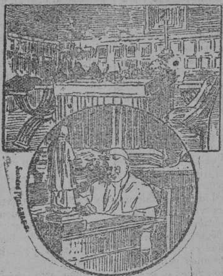
Su Santidad Pío X.

La suerte que pueda caber en lo futuro a las relaciones entre los dos pueblos, esos monumentos perdurarán incólumes, protegidos por la calidad de los genios a que se dedican. La cultura de los ciu-