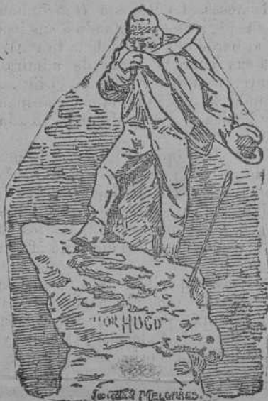
Estatua a Victor Hugo

El gobierno de la vecina república pregona que el hecho no ha de hacerle cambiar de rumbo. Que la ley de separación se cumplirá en todas sus partes.