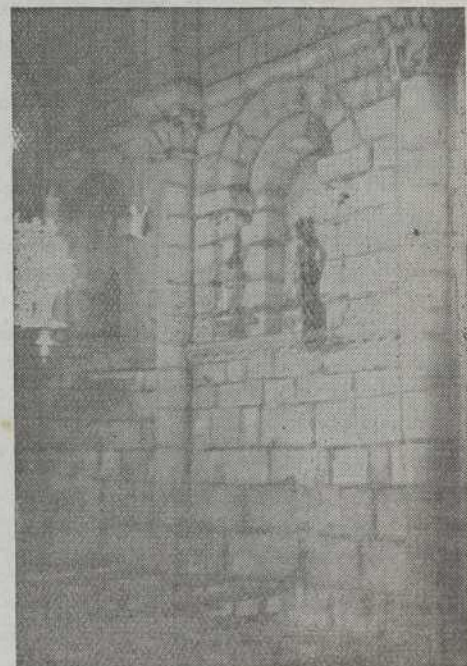
CAPILLA DE LOS DOLORES.-Lienzo románico

Esta nave lateral, de la Epístola, que vamos siguiendo, vuelve en el crucero hacia el altar de los Dolores, netamente románico. El lienzo de la derecha de