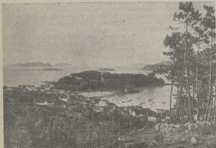
BAYONA.- La península de Monterreal convertida en plataforma de las preocupaciones turísticas de la zona Sur de Galicia.

Con motivo de la urgente planificación de la zona, todo esto hay que estudiarlo y resolverlo, buscando la solución más propicia al problema, pues, lo que es preciso evitar a toda costa, son los odiosos contrastes y las ostensibles y remediabiles cojeras, para que el promedio de las calificaciones, cuando menos, nos dé el ansiado aprobado ante el tribunal más exigente.