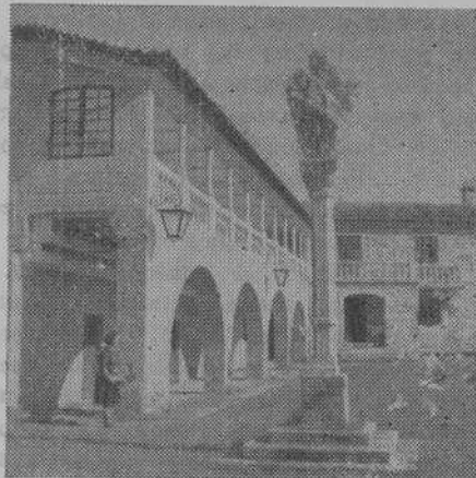
TUY.-Pousa de S José. "O xantar das pombas no Pazo"

Esta información de "EDITUR" confirma las noticias oficiosas llegadas a este C. I. T. —de las que ya dimos cuenta— y rebate la creencia reciente de que la adquisición del Castillo de Monterreal imposibilitaba la concesión de nuestro Parador, pues simultáneamente se señalan tres nuevos para Galicia: Tuy, Bayona y Verín.