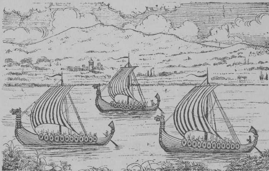
"VIEJA ESTAMPA.-Vanguardia de una escuadra wikinga a la altura de Ganfey. (Véase texto página 10)

En un futuro próximo se complementará con la erección del Monumento a Calvo Sotelo, así como con la rectificación y mejora de sus aceras.