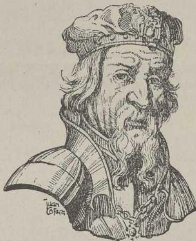
Pelagius I-hijo de Tuy-XXXIV Hispaniarum Rex Primer Rey de Reconquista.

Desde la destrucción de la ciudad en el año 715 hasta el 915, en que Ordoño II ordena al Obispo Hermoigio abandonar Iria-Flavia, para fijar aquí su residencia, la Iglesia y Monasterio de San Bartolomé asumen todas las funciones de capitalidad y responsabilidad de la diócesis y provincia, por lo que alcanza gran importancia.