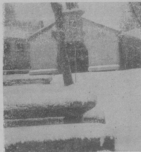
TUY.-La capilla de S. Julián perdida en la nieve, acogedor refugio entre el frío ambiente.

Un buen programa de exaltación turística de la ciudad.