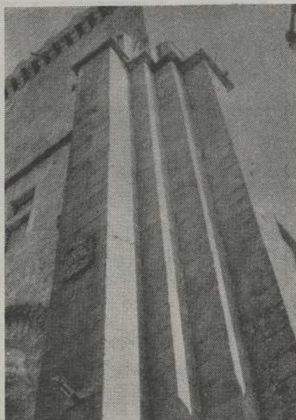
TUY Curiosa perspectiva de los contrafuertes exteriores de la Torre del Homenaje de la Catedral-Portaleza.

6) Incremento y actualización de la red de alojamientos, así como de todos los establecimientos en contacto directo con el turismo. Urgencia de la construcción del Parador de Túa, incluido en el Plan de nuevas instalaciones del Ministerio de Información y Turismo, especialmente como contrapartida al de Valença do Minho y a la pérdida de divisas que su exclusiva supone.