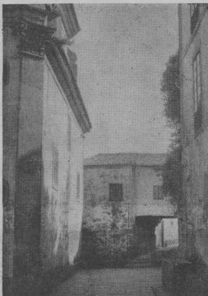
TUY.—Típico túnel contiguo a la Capilla de San Telmo, de tras del cual, puede seguirse un itinerario medieval.

Dada la trascendencia del Certamen, este Centro de Iniciativas y Turismo se ocupó, con la debida antelación, de que nuestra ciudad estuviera bien representada, consiguiendo que, dentro de la forzada brevedad de espacio asignado a cada provincia, aparezcan dos fotografías de extraordinaria calidad: una en negro, de 1x0'80 del soberbio Pórtico de la S. I. Catedral, y otra, en color, de 0'50x0'60, titulada "Tuy.—Romería en el río Miño", que representa una estupenda concentración de barcos miñotos engalanados frente al telón de fondo de nuestra ciudad.