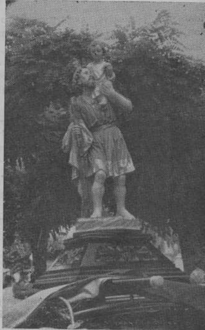
Imágen del Santo adquirida por suscripción entre los usuarios de vehículos

Hubo Misa de Campaña, Bendición de Vehículos y Procesión Motorizada.