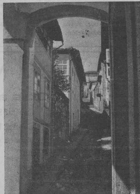
La óptica fotográfica no se cansa en Tuy de sus pintorescas perspectivas, como esta hecha en la Cani-ouva.