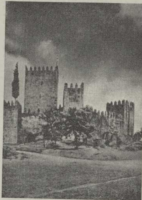
Castillo de Guimaraes, cuna de la independencia portuguesa donde nació y se crió el Infante Alfonso Enriquez.

Alfonso Enriquez, sin embargo, no se atreve todavía a la anexión de los ansiados territorios miñotos y regresa a Portugal acompañado de todas sus tropas.