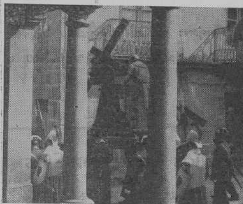
Como una nueva Jerusalén la vieja ciudad ambienta singularmente los actos de la Semana Santa, como este Paso de Jesús con la Cruz a Cuestas, en las cercanías de la Catedral.

Dada la importancia que estos actos revisten, sería muy aconsejable que para el año próximo, y con tiempo suficiente, se le prestara la debida atención a estas manifestaciones que destacan por su recogimiento y suntuosidad, dedicándole una mayor propaganda y difusión no sólo en la Comarca sino en el norte de Portugal.