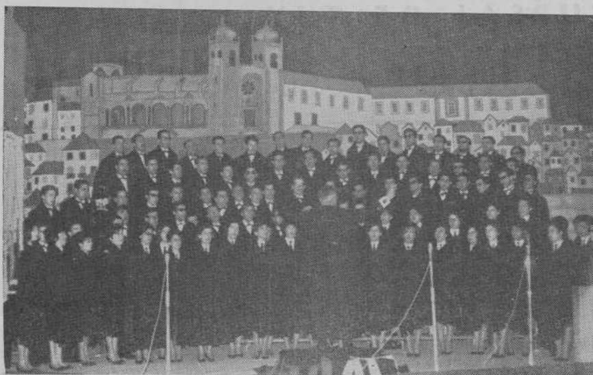
Un momento de la actuación del Orfeón Universitario de Oporto en nuestra ciudad.

Con la alegre presencia de los universitarios portugueses se abrió, a modo de prólogo, el Programa de las Fiestas Patronales anticipadamente.