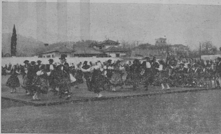
El Grupo de Santa Marta de Portuzelo en plena exhibición de su arte.

Desde hace bastante tiempo este C. I. T. tenía deseos de incluir en el Programa de Fiestas, un espectáculo que se saliera de la rutina de los presentados todos los años. No era tarea fácil conseguir dicho objetivo y, al propio tiempo, lograr que éste fuera del agrado general.