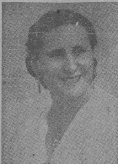
Maria Teresa Estremera, distinguida "mezzo" soprano, una de las primeras figuras de la gran temporada de Opera que va a comenzar próximamente en La Coruña

En pocas ocasiones se podrá escuchar un "Rigoletto" tan completo como el que nos ofrecerá el Casino de La Coruña en la primera función de la magnífica temporada de Opera que organiza.