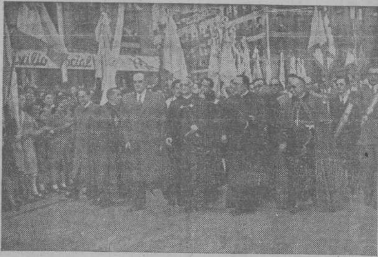
El Cardenal Caggiano, a su llegada a Madrid, es recibido entusiastamente por millares de personas.

RECIBIMIENTO EN MADRID AL CARDENAL ARGENTINO CAGGIANO