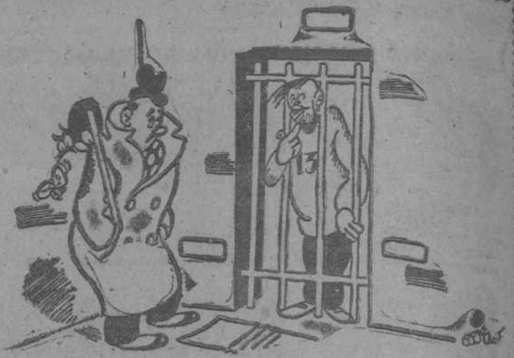
NOTA, por Miranda —Te encuentro muy afectado. —¿"Afectado" con esta barba?

(World copyright by United Features Syndicate. Derechos exclusivos para su publicación en España, adquiridos por la Agencia EFE. Prohibida la reproducción).