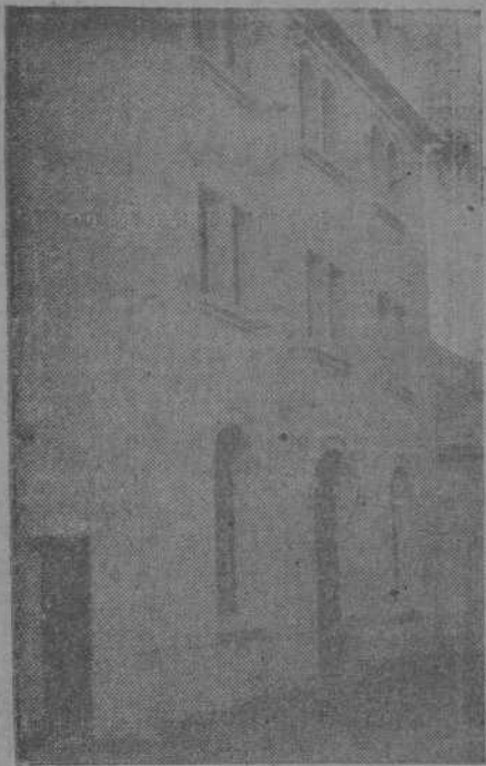
Un aspecto de la nueva Capilla de los PP. Capuchinos, abierta ayer al culto. — Momento de ser trasladado procesionalmente el Santísimo desde la antigua Capilla a la recientemente construida.

Con gran solemnidad se efectuó ayer el traslado del Santísimo de la capilla, donde estuvieron instalados los Padres Capuchinos desde que la horda destruyó con un incendio la primitiva Residencia de dicha benemérita Comunidad, a la nueva, erigida en el mismo lugar del desastre, merced a la caridad y fervor de los fieles.