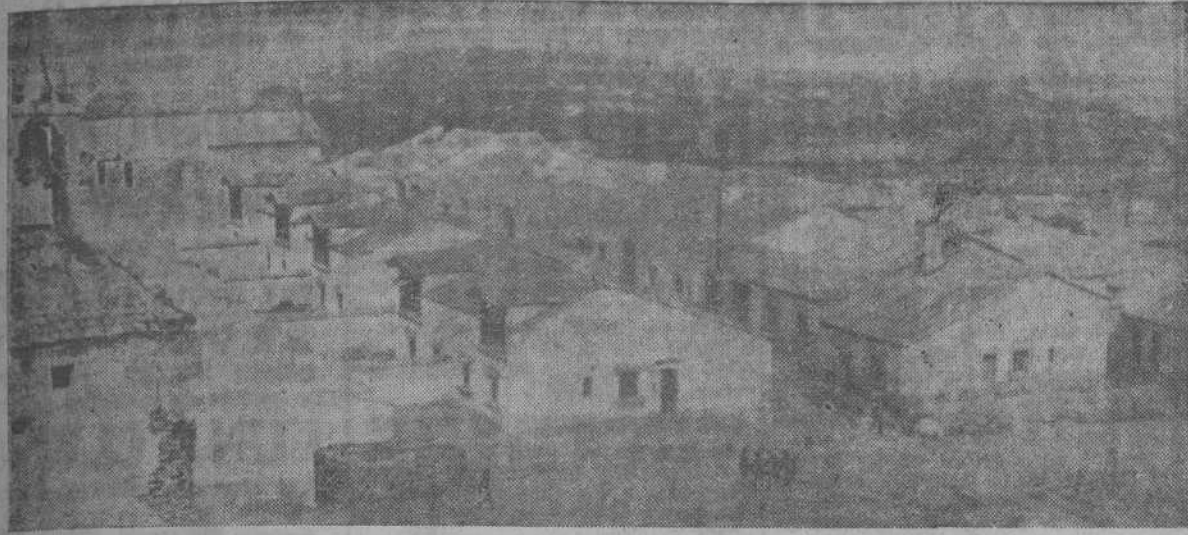
ASPECTO DE UNO DE LOS BARRIOS DEL NUEVO PUEBLO DE BRUNETE, CONSTRUIDO DE NUEVA PLANTA

DESCUBRIO UNA LAPIDA EN LA PLAZA QUE PERPETUA LA GLORIOSA BATALLA EL VECINDARIO ACLAMO A FRANCO FERVOROSAMENTE