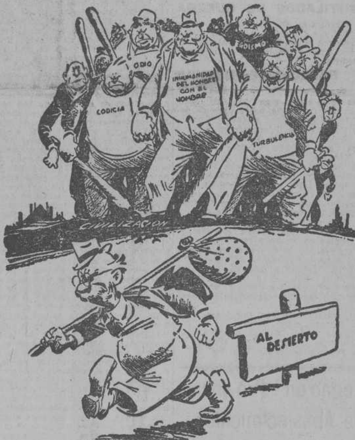
¿NO HA SENTIDO USTED TAMBIEN EL IMPULSO?

BERLIN 12.—Una delegación de mineros alemanes ha llegado a esta capital para protestar ante el Consejo de control aliado y el mariscal Sokolovski, jefe de las fuerzas de ocupación soviéticas, por el desmantelamiento del equipo de las minas de Semberg por los rusos. —(EFE)