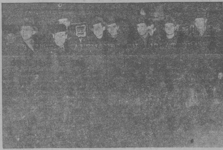
LONDRES.—He aquí algunos de los técnicos alemanes que fabricaron en la guerra las famosas bombas cohete “V”, a su llegada a la Estación Liverpool de Londres, para trabajar voluntariamente en Inglaterra. (Foto CIFRA).