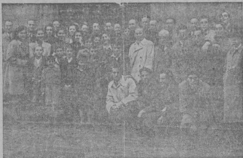
Músicos y cantores coruñeses que actuaron en la solemne misa celebrada en la Iglesia de San Nicolás, con motivo de la fiesta de Santa Cecilia

Los actos celebrados ayer en honor de la patrona de los músicos resultaron muy solemnes y brillantes. A las doce de la mañana hubo una misa cantada en la Iglesia de San Nicolás, ante el altar mayor, en donde se había colocado un cuadro de la Santa Mártir. Fué interpretada la misa segunda del Sacramento, de Ribera, por el Coro y Orquesta del señor Barrero, reforzada por valiosos elementos del Conservatorio, organizador del acto, de la Sociedad Filarmónica, y de otras colectividades artísticas