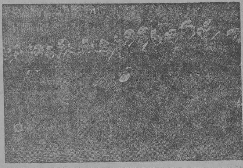
MADRID.—El ministro de Educación Nacional, señor Ibáñez Martín; el presidente de la Real Academia Española, señor Pernán, y otras personalidades, en la presidencia del entierro del ilustre poeta y dramaturgo don Manuel Machado.