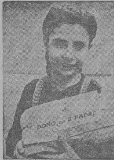
ROMA.—Esta niña sonríe satisfecha con el donativo que Su Santidad el Papa le ha entregado con motivo de las pasadas fiestas de Navidad.

IMPONENTE MANIFESTACION EN EL ENTIERRO DE UN GUARDIA CIVIL ASESINADO EN MADRID (Página tercera)