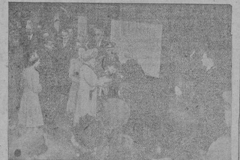
El Rey Jorge, su esposa y sus hijas saludan en la Estación Waterloo a las personalidades que acudieron a despedir a la familia real con motivo del viaje a África del Sur

Delante marchaba el portaviones "Indefatigable"; poco después el acorazado "Vanguard", la más moderna unidad de la flota británica, en el que hacen el viaje SS. MM. con sus hijas; al costado del "Vanguard" marchaba