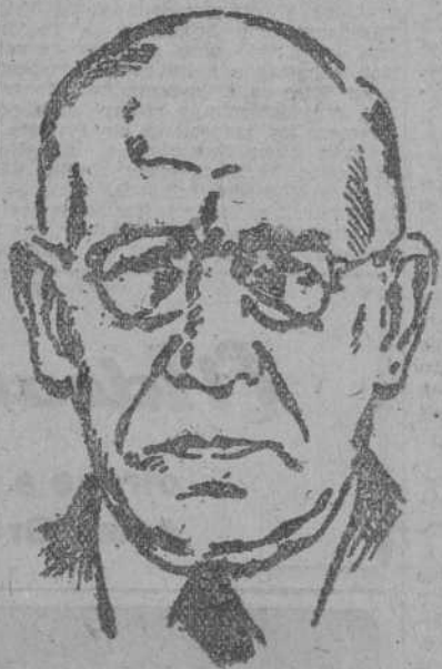
CARLTON J. HAYES

CIUDAD DEL VATICANO, 5.—La conferencia de los obispos húngaros del 20 de julio de 1946 había decidido fundar una Universidad católica. El núcleo de ella está constituido por la Academia católica de Jurisprudencia, la