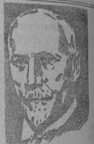
El General Smuts, Presidente de la Unión Sudafricana

cen del amparo de la ley. Y también en el proyecto se dice que el derecho de locación será transmitido al cónyuge del arrendatario muerto. Esto es un detalle totalmente inadmisible, que no está de acuerdo con lo que la Constitución portuguesa afirma, ni con la (CONTINUA EN SEXTA)