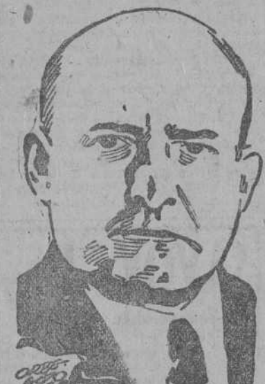
STANISLAW MIKOLAJCZYK Jefe del partido campesino polaco

Los soberanos y las princesas admiraron desde el navío las bellezas de la Isla