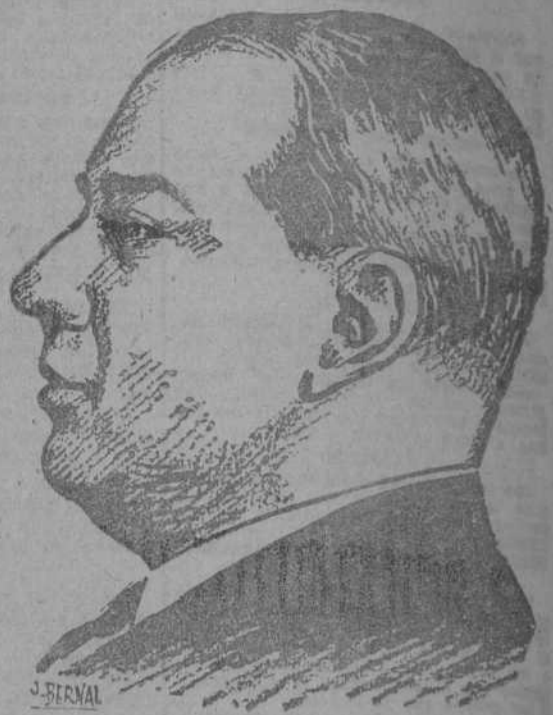
Por L. MIRA.

Biólogos y filósofos vitalistas coinciden en afirmar que de cada cien hombres gruesos sólo uno o dos están bien dotados para la lucha por la vida o, por mejor decir, para el triunfo vital. Y añaden que, si un gordo es, al tiempo un hombre con personalidad y temperamento, tiene grandes probabilidades de ganar con mucho a los flacos. El grueso con nervio es el tipo característico del hombre de presa, del político temible o de empresario ganancioso. Pues bien, Antonio Ferro, el actual Secretario Nacional de Información de Portugal, gran amigo de España, tiene sobrados méritos para que unos y otros—biólogos y filósofos—le cuenten entre esa escasa proporción de hombres triunfadores. Trazar su semblanza, tan oportuna con motivo de los actos de fraternidad hispano-lusa que se han celebrado en España y de los que Antonio Ferro ha sido el primer protagonista, es sumamente agradable para un periodista. Primero, porque se trata de traer a la palestra una figura que ama este lugar de lucha; y segundo, porque este espléndido gladiador de la propaganda es, ante todo y sobre todo, un periodista también. Un periodista de los mejores con que hoy cuenta el mundo, seguro de que, para serlo enteramente, hace falta contar con rasgos de preocupación y de vocación literaria y poética, y con ambiciones de dimensión política. Una cualidad y otra, la sensibilidad poética y la orientación política al servicio de su país, adquieren en Antonio Ferro matices de excepción.