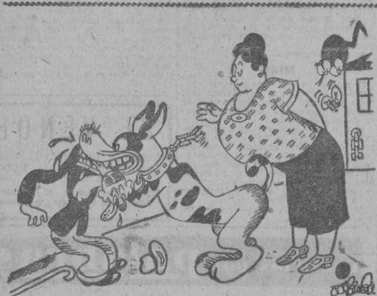
PERRITO, por MIRANDA