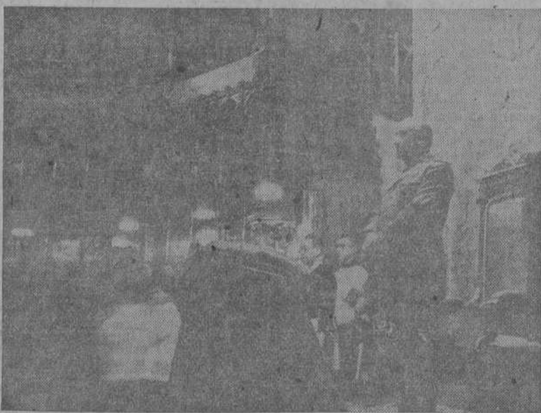
Su Excelencia el Jefe del Estado, en la Basílica del Monasterio de Montserrat, donde asistió a una solemne función religiosa.