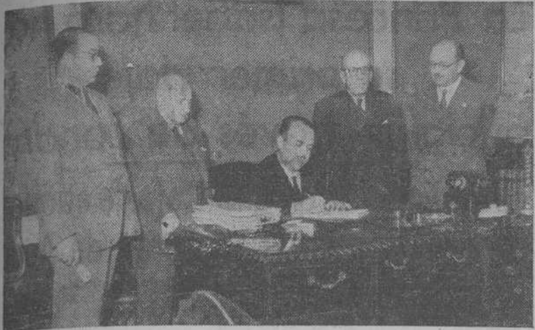
MADRID.—Momento de la firma, en el Banco de Crédito Local de España, de una operación de crédito con el Ayuntamiento de La Coruña, por un importe de dieciséis millones trescientas mil pesetas, que se destinarán para la construcción de Hospitales, Clínicas, etc.