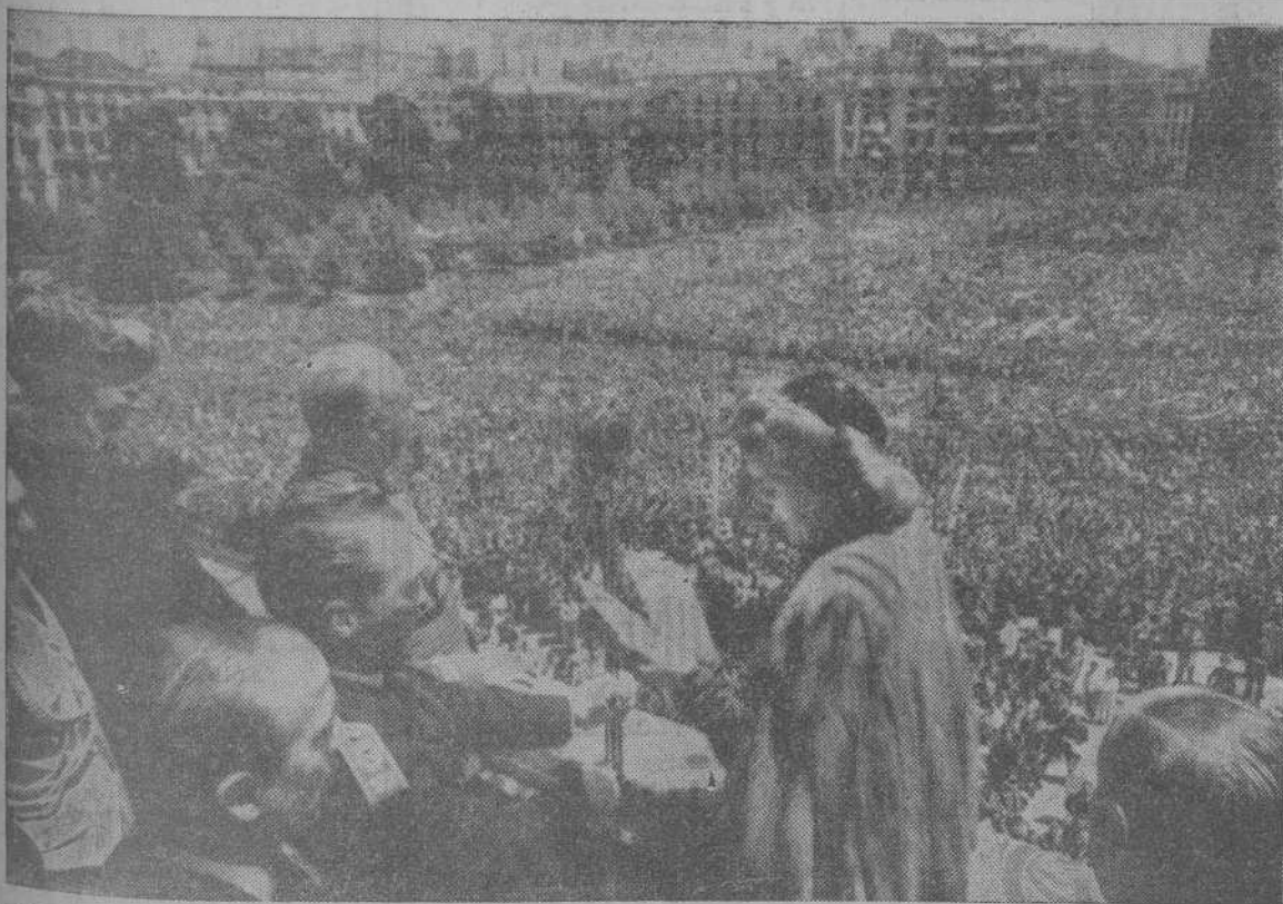
La esposa del Presidente argentino, doña María Eva Duarte de Perón, con Su Excelencia el Jefe del Estado, en el salón del Palacio de Oriente, desde el cual recibió la clamorosa y entusiasta adhesión del pueblo de Madrid.

ATLANTIC CITY, 10.—Los médicos que asisten al Congreso que se celebra en esta ciudad con motivo del centenario de la Federación de médicos americanos, esperan encontrar definitivamente el tratamiento que ponga fin a las úlceras de estómago. En el Hospital de Newark se han realizado experimentos en estos meses pasados con gran éxito. Se trata de curar úlceras de estómago con resina sintética. De los sesenta pacientes sometidos a ese tratamiento, 46 sanaron. (EFE).