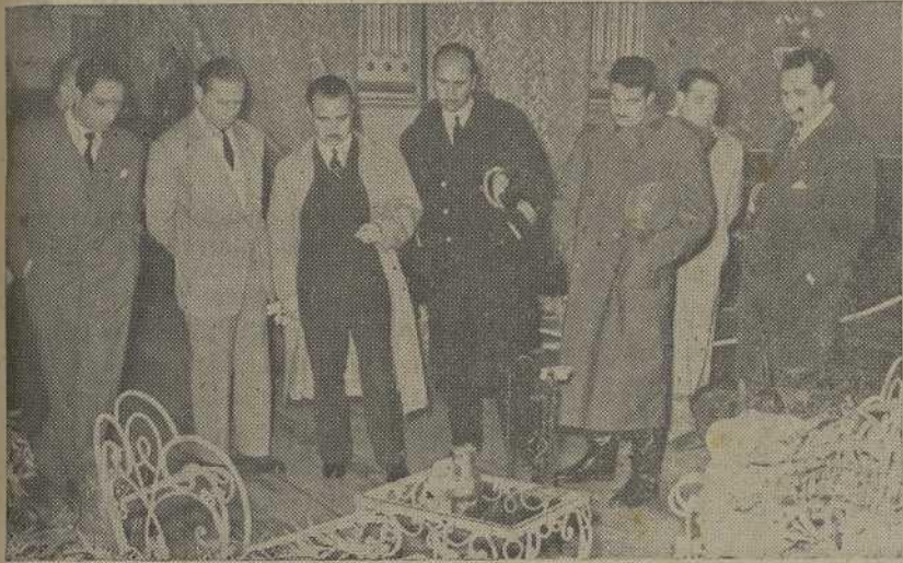
Autoridades y jerarquías examinan los trabajos expuestos

En el salón del Hogar del Productor de nuestra ciudad, tuvo lugar el pasado día 15, la inauguración de la Exposición Provincial Selectiva de Artesanía.