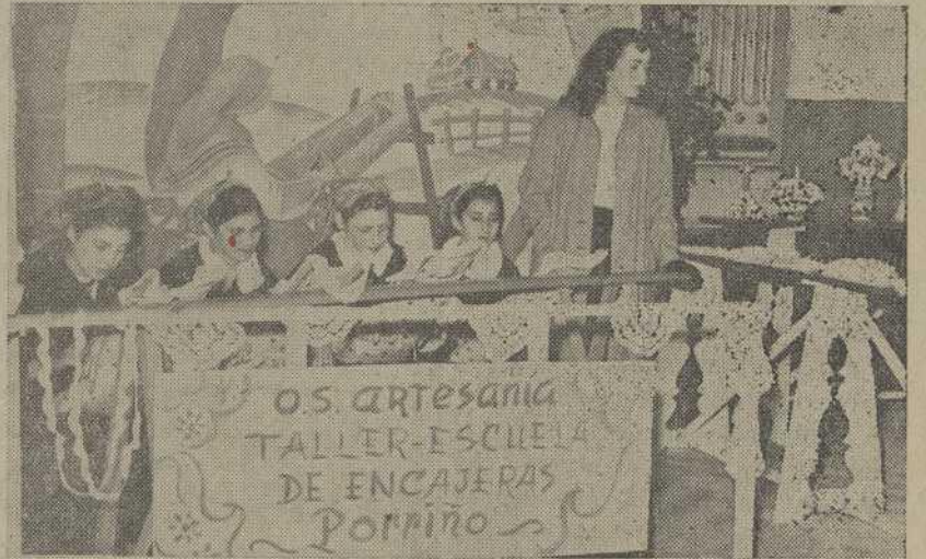
Las alumnas del Taller-Escuela Artesano de Porriño, haciendo encajes a la vista del público

Fué inaugurada, bajo la presidencia del Excmo. señor Gobernador civil de la provincia