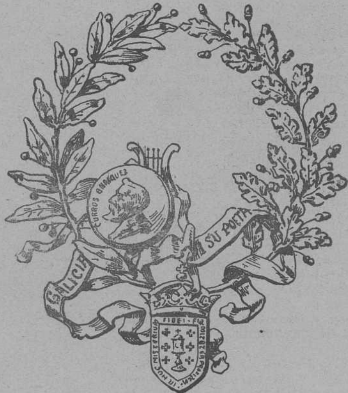
Corona de plata y oro ofrecida al Sr. Curros Enríquez

Si me conceden treguas duros azares para evocar la imagen de tu Galicia,