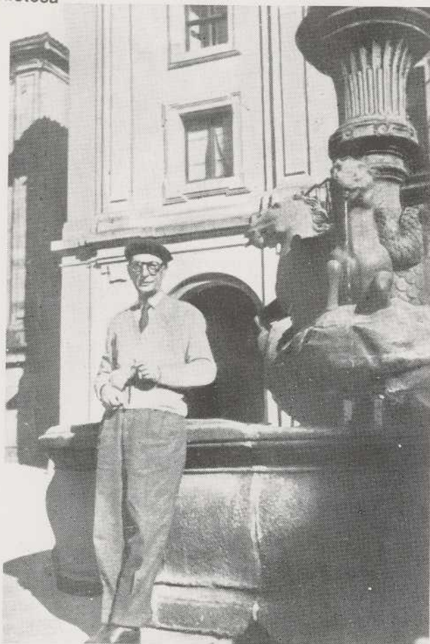
LUÍS PIMENTEL (1895 - 1958)