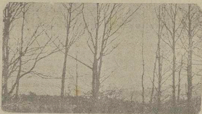
Delicioso paisaje gallego a orillas del río Ulla entre Puentecesures y Catoira