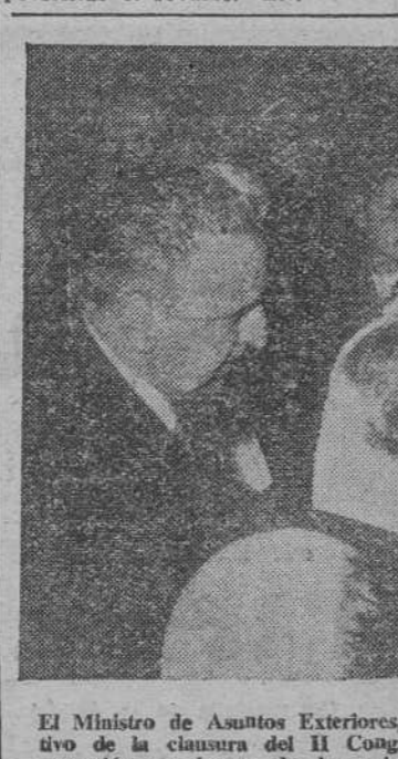
El Ministro de Asuntos Exteriores, Sr. Martín Arriaga, ofreció, con motivo de la clausura del II Congreso de Académicos de la Lengua, una recepción en honor de los miembros del mismo, que se celebró en el palacio de Viena.