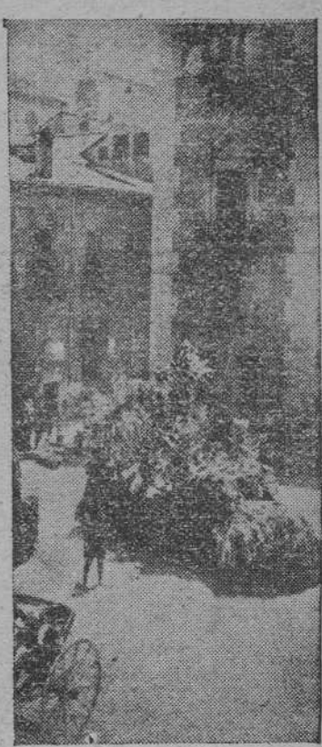
Las calles más céntricas de Madrid, desde la plaza del Dos de Mayo hasta el Ayuntamiento, vieron cruzar la tradicional cabalgata chispera con las Cruces de Mayo de todos los distritos de la capital.