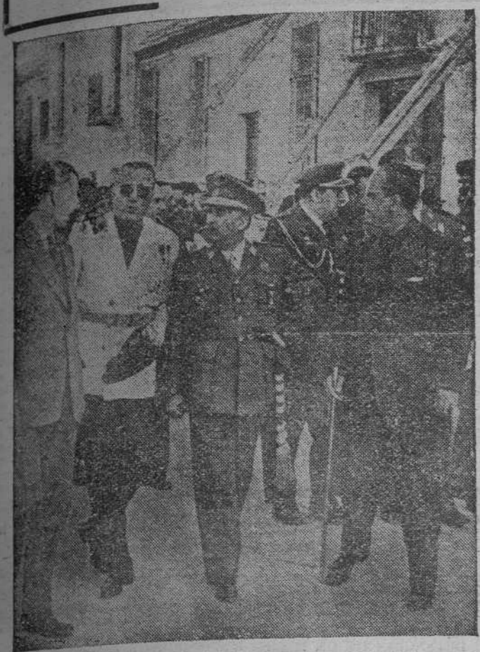
Su Excelencia el Jefe del Estado, durante su visita a las zonas de Granada afectadas por los terremotos, donde la población, como en todos los lugares recorridos, le hizo objeto de un apoteósico recibimiento