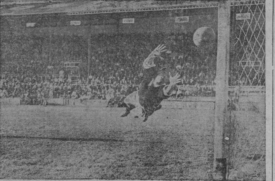
La estrada del guardameta vallisoletano fue inútil ante el remate bien colocado de Albino, que consiguió así el tanto del Celta