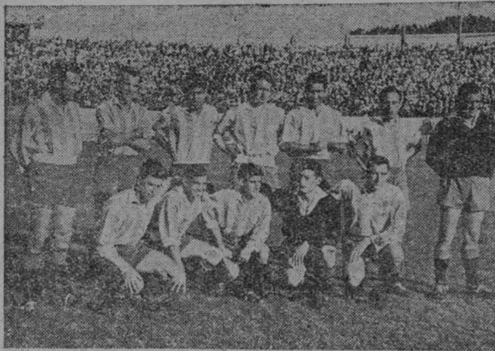
Este es el equipo del Real Valladolid que el domingo arrancó en Balaídos un valioso punto

Celta: Adauto; Arranz, Villar, Soane; Arce, Gutiérrez; Gausi Omedo, Albino, Cerdá y Torres