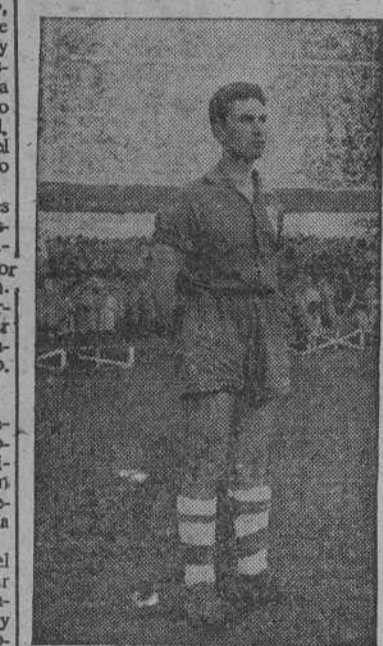
D I A Z

Tampoco esta vez se desanimaron los santiagués. Los centenares de "hinchas" que se habían trasladado desde Compostela y los santiagués.