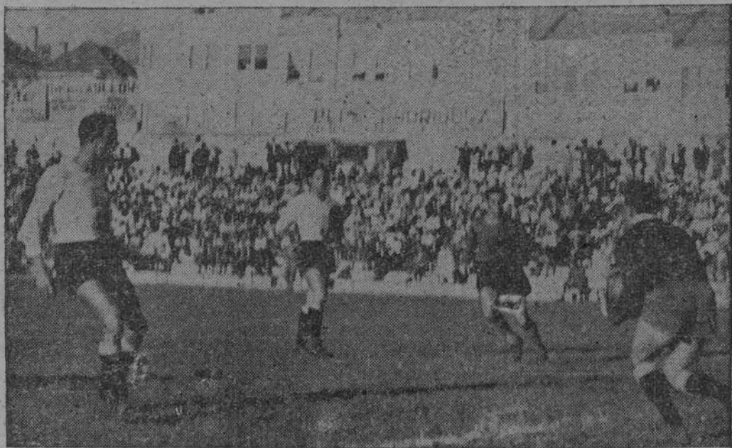
El partido fue tan soso y sin complicaciones como esta jugada. Tucho que tira y el portero, tranquilizo, sin acosar ni preocupaciones, bloca.

La pobreza de juego ofrecida por ambas partes, quedó reflejada en el marcador )-( Crónica de KINSU