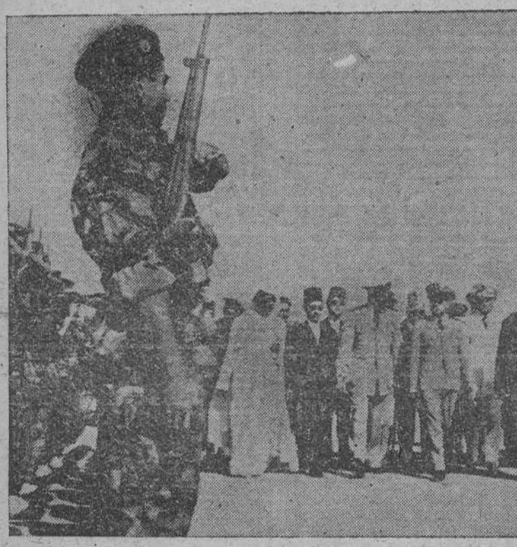
El príncipe heredero de Marruecos, Muley Hasán, acompañado del general Mizian y otras personalidades, revista las fuerzas que le rindieron honores a su llegada a Tetuán. El príncipe impuso al general Mizian las insignias de teniente general y le proclamó jefe de las fuerzas marroquíes.