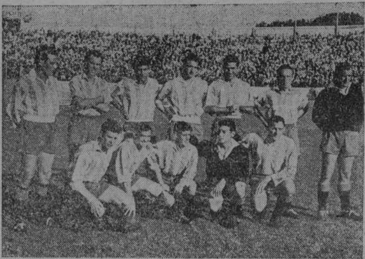
Este es el equipo del Real Valladolid que el domingo arrancó en Balaídos un valioso punto

si bien la jugada que le precedió corrió a cargo del extremo izquierdo Torres. Y es lo que respecta al mencionado Torres y a quien el público en última instancia confiaba como