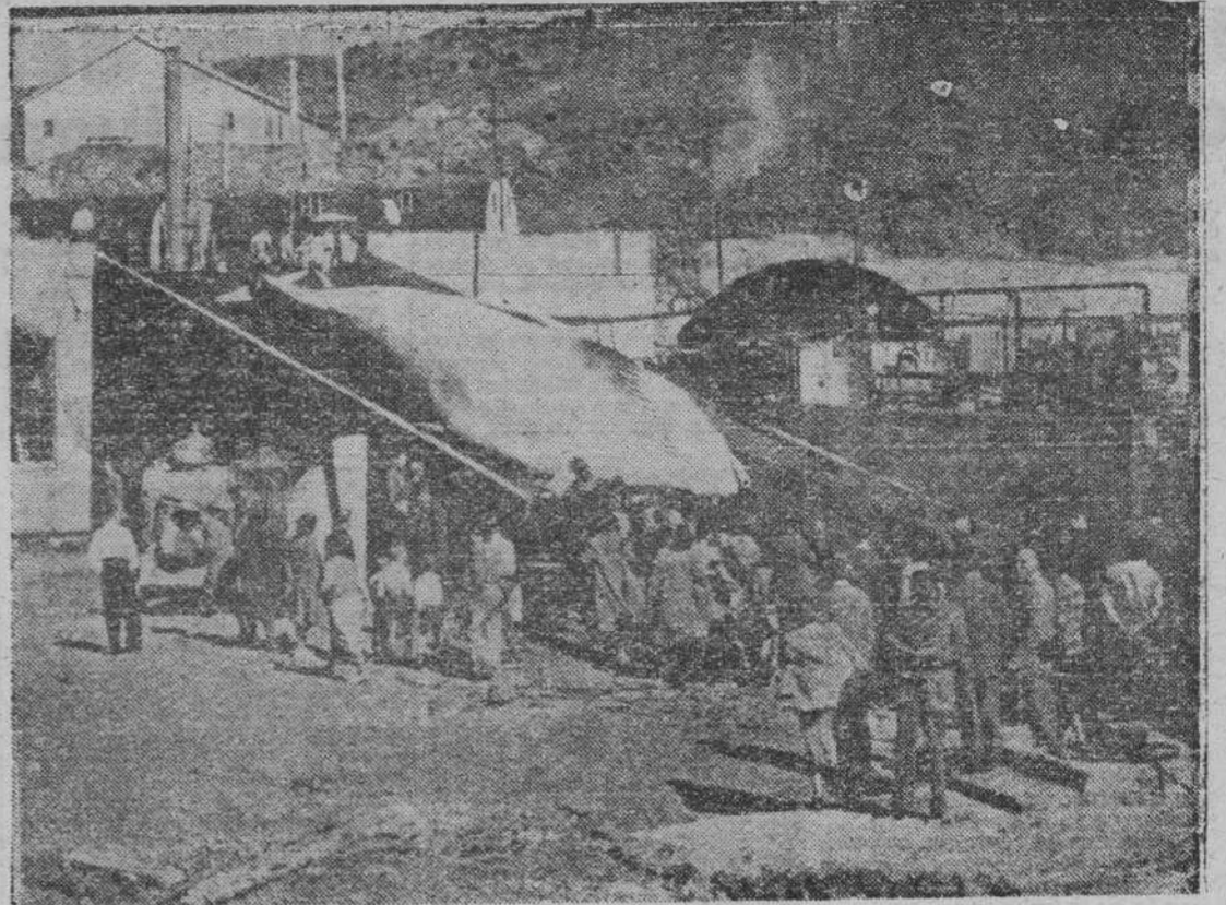
La inmensa ballena azul es izada por la enorme rampa de la factoría de Hvalofjordur