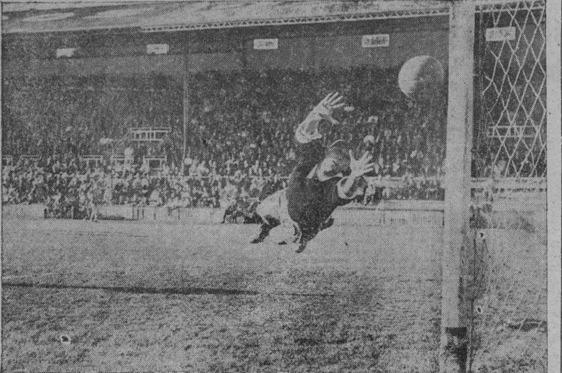
La estrada del guardameta vallisoletano fue inútil ante el remate bien colocado de Albino, que consiguió así el tanto del Celta