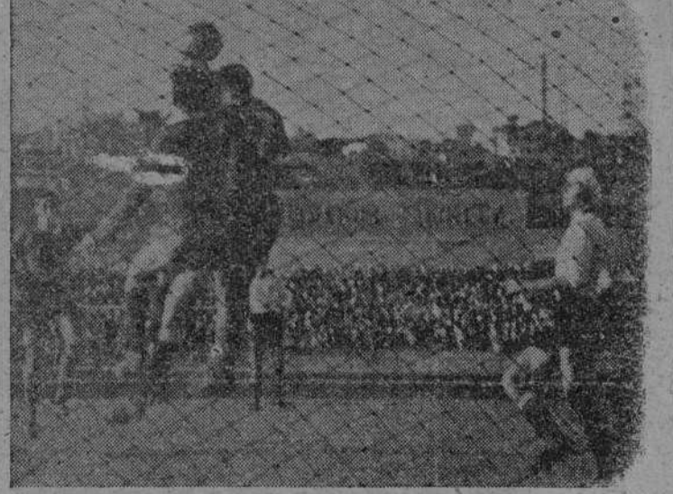
El balón rondó las mallas muchas veces. Aquí lo vemos, a través de ellas, bajo el acoso de Montes que quiere impulsarlo hasta la red y Jesús que lo evitará, como lo evitó toda la tarde, no tanto por su pericia, cuanto por la ingeniosa combatividad de los verdes.