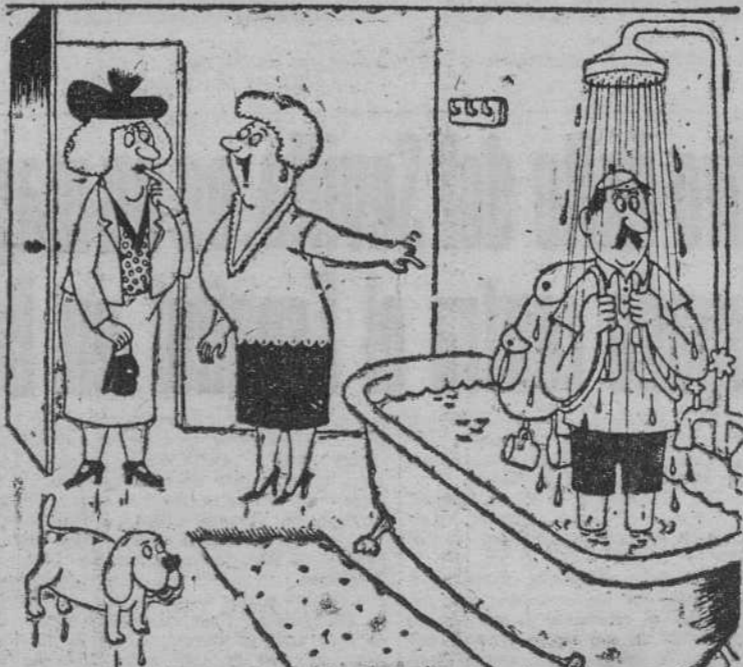
—Mi marido se prepara para las próximas vacaciones. (De «France-Dimanche».)

Lo único que se intentaba decir aquí es que hay una causa, no arbitraria, del precio del bacalao islandés. Antes de que el producto haya llegado al consumidor se ha tenido que desarrollar un complicado procedimiento, que va desde la pesca hasta la organización exportadora. Para ello se requiere la inversión de grandes cantidades que hay que amortizar urgentemente. Es preciso, además, reconocer que la pesca es, en definitiva, la única industria de Islandia, o sea, que todo un país vive prácticamente de la exportación de pescado y sus derivados acusando en seguida la crisis producida por los malos años o por la disminución en las exportaciones. El precio del bacalao en los mercados extranjeros es el exponente de este juego de azar de la pesca, a que está dedicada una nación entera.