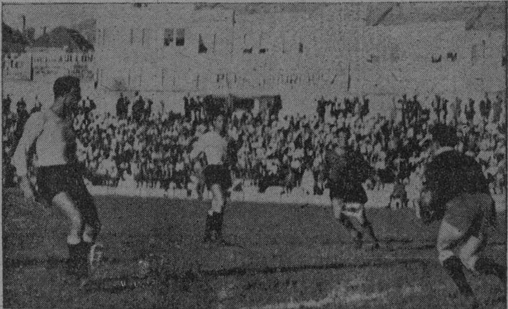
El partido fue tan soso y sin complicaciones como esta jornada. Tucho que tira y el portero, tranquilos, sin acosos ni preocupaciones. bloca.

La pobreza de juego ofrecida por ambas partes, quedó reflejada en el marcador )-(