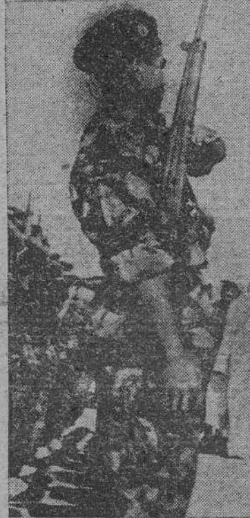
El príncipe heredero de Marruecos, Muley Hasán, acompañado del general Mizian y otras personalidades, revista las fuerzas que le rindieron honores a su llegada a Tetuán. El príncipe impuso al general Mizian las insignias de teniente general y le proclamó jefe de las fuerzas marroquíes.