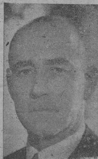
(Información en tercera página)