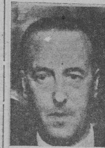
EL MINISTRO DE TRABAJO, Sr. SANZ ORRIO

Administración. En esta labor espinesa el espíritu de colaboración y el desinterés de cuantos sirven al Instituto se ha puesto en juego con éxito no-