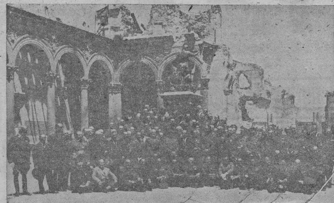
Su Excelencia el Jefe del Estado rodeado de sus compañeros de promoción en el patio del glorioso Alcázar toledano, durante la celebración del 40 aniversario de la fecha en que fueron entregados los despatchos a la XIV Promoción de Infantería, a la que pertenece el Caudillo