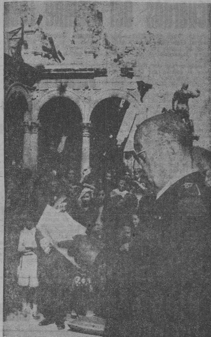
El teniente general Moscardó en el Alcázar de Toledo durante un acto conmemorativo del asedio

VIENE DE ÚLTIMA PAGINA disparos de 155 el día 20... Consecuencia de este recrudescimiento, es el tener que abandonar el Gobierno Militar, y poco después, Puerco de Hierro, Santiago, comendador, fregaderos, la cuadrilla cuartá y la compañía de tropa lo que se lleva a efecto en la noche de dicho día, después de trasladar todo lo aprovechable e incendiar aquellos locales.