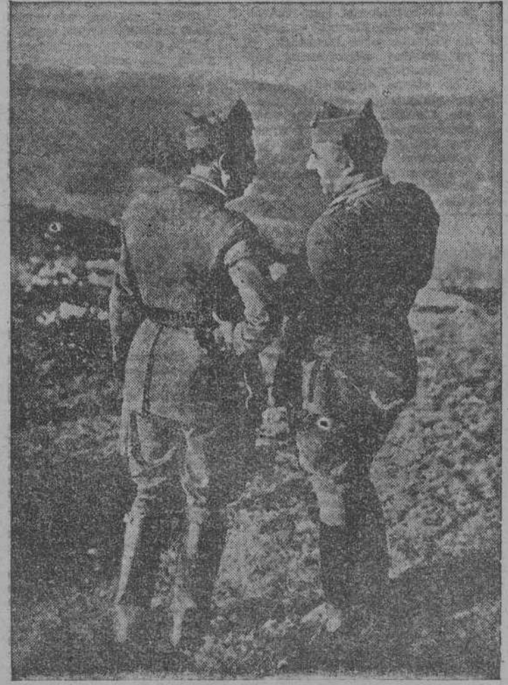
El Caudillo, con el general Dávila, en uno de sus puestos de mando durante la Guerra de Liberación

La acción principal sobre el bajo Ebro, se llevaría a cabo por el arco que describe dicho río, alrededor de Gandesa, formando un semicírculo entre los pueblos de Fayón y Benifallet. El terreno aparece aquí formado en gran extensión por ondulaciones y barrancos muy monótono y difícil, para la observación, la marcha y el combate, por la casi identidad de los accidentes; alcanzándose sobre esta monotonía una serie de elevaciones dominantes: Puig Caballé, Sierra de Cabals, Pandols, Llavell, Picosa, Perlas, Aguilas y Montes de Farallá. La lucha en el arco de Gandesa tenía que ser pues, ante todo, una lucha por la conquista de las alturas citadas. Defensa desde el lado nacional del curso del bajo Ebro el Cuerpo de Ejército marroquí (Yagüe) que constaba de tres divisiones; de éstas, la 5ª y la 105 se hallaban en línea, al Norte y Sur, por el orden indicado, y la 3ª en reserva. La división 5ª, era de nueva creación, el general Yagüe la había formado con