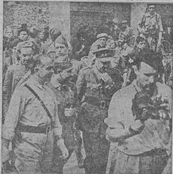
El general Varela y el entonces coronel Moscardó, a un lado y otro del Caudillo, en el histórico día de la liberación del Alcázar.

Al siguiente día, tuvo lugar la conversación telefónica entre el coronel Moscardó y el jefe de las milicias rojas de Toledo, que amedrentaba a aquel con fusilar a un hijo suyo, al que tenía en rehenes, si no se rendía la fortaleza. Conocida es la negativa del coronel y el