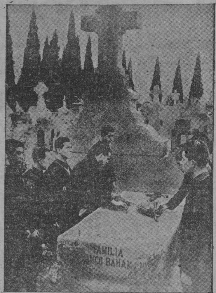
MADRID. — Afiliados del Frente de Juventudes, en la festividad de la Inmaculada Concepción, en que se celebra el Día de la Madre, rindieron homenaje y respeto ante la tumba que guarda los restos mortales de doña Pilar Bahamonde de Pardo de Franco, madre de S. E. el Jefe del Estado