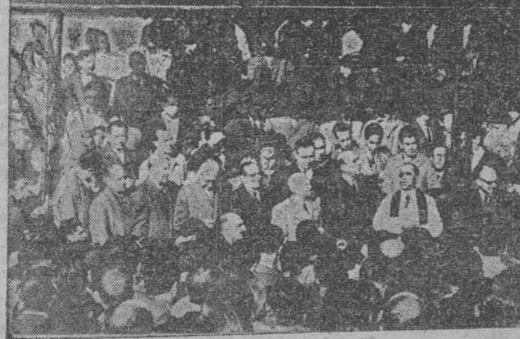
Con asistencia del Ministro de Obras Públicas, se celebró el domingo, en la capital de España, la bendición de los terrenos, a orillas del Manzanares, donde se levantará un monumental estadio para el Atlético de Madrid.

CLUB ATLETICO DE MADRID OBRA DE CONSTRUCCION DEL ESTADIO DEL MANZANARES