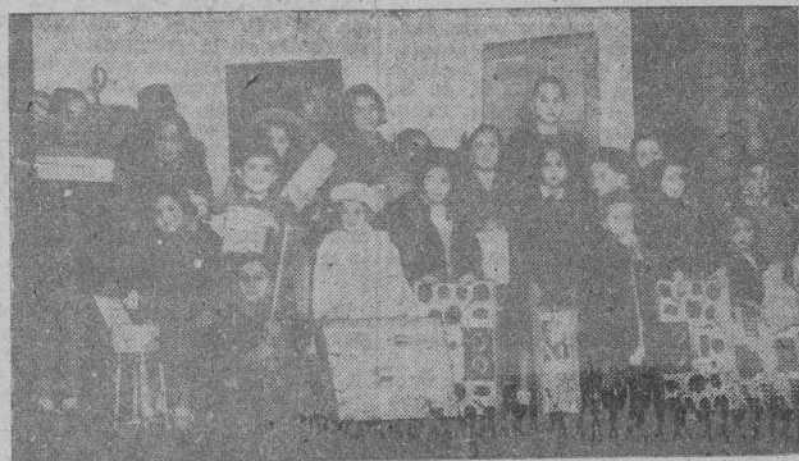
Grupo de niños que asistieron a la función infantil de Reyes Magos, organizada por la Asociación de la Prensa de La Coruña

Hubo reparto de magníficos juguetes, función teatral y espléndida merienda