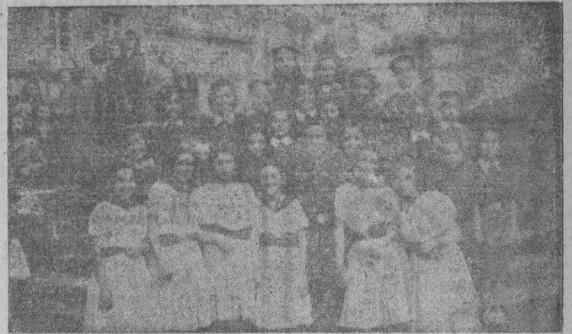
El coro de Flechas, del Frente de Juventudes de la Sección Femenina que obtuvo el segundo premio