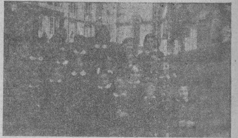
El coro integrado por acogidas en el Hospicio Provincial que ganó el primer premio en el concurso de villancicos, organizado por el Frente de Juventudes de la Sección Femenina

rias bases navales y un importante aeródromo germano-italiano, en el que contempló la salida de una escuadrilla de aviones de transporte que, cargados de material de guerra, se dirigían a África.