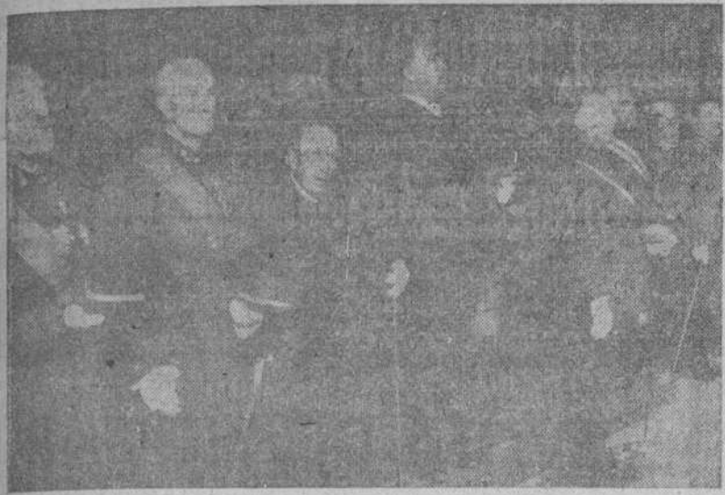
El Capitán General de la Octava Región Militar y otras autoridades durante la solemne recepción celebrada en el Palacio de Capitanía.

Se rindió homenaje a un veterano del Ejército