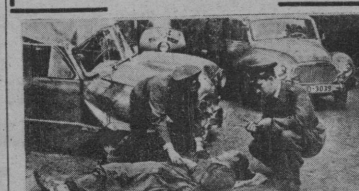
Una fábrica de relojes ha tenido la iniciativa de lanzar un nuevo modelo de reloj de pulsera con un departamento de acero especial que resiste hasta cien grados de temperatura. En caso de accidente grave, la Policía o cualquier persona que acuda a prestar auxilio encuentra en el reloj los datos del accidentado: nombre, domicilio y grupo sanguíneo. Una demostración del nuevo invento y el reloj