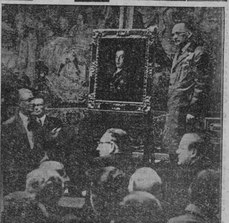
El retrato de Wellington, de Goya, durante la subasta pública celebrada el pasado mes de junio, en Londres, cuando fue adjudicado en ciento cuarenta mil libras. Posteriormente lo adquirió la National Gallery