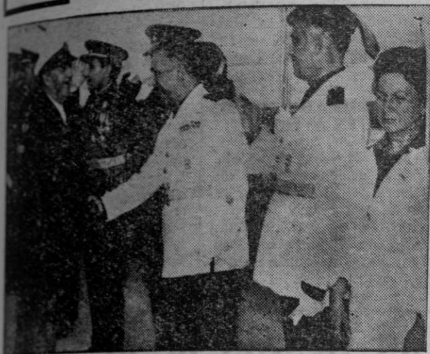
El Jefe del Estado, Generalísimo Franco, recibiendo el saludo de las jerarquías coruñesas del Movimiento, al desembarcar en Sada.