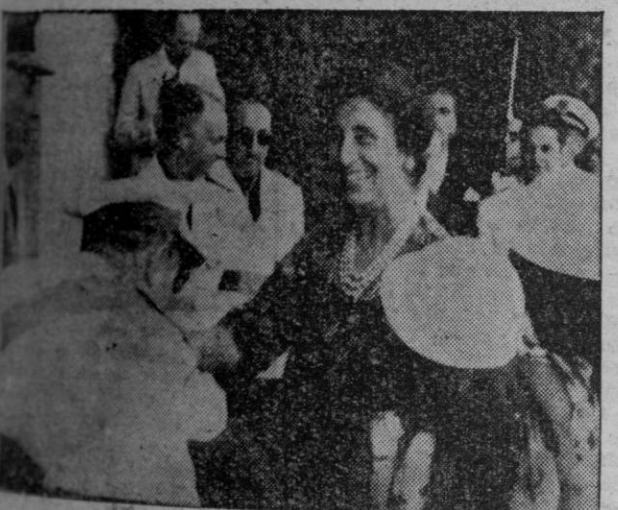
Dona Carmen Polo de Franco, saludada por las autoridades coruñesas a su llegada al Pazo de Melrás.